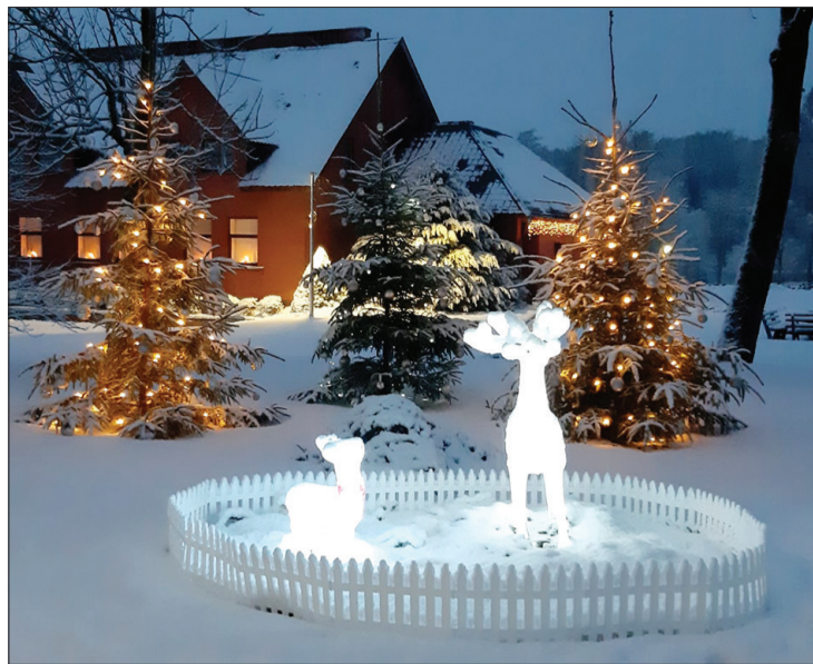
Kalētos centrā pie pagasta pārvaldes starp eglītēm apmetusies briežu ģimenīte.

Lai jums gaiši, sirdssilti un priecīgi Ziemassvētki un laimīgs jaunais 2022. gads!