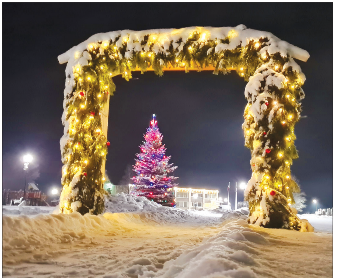
Priekules Ģimeņu dārzā tagad var nokļūt, izejot cauri grandioziem vārtiem.