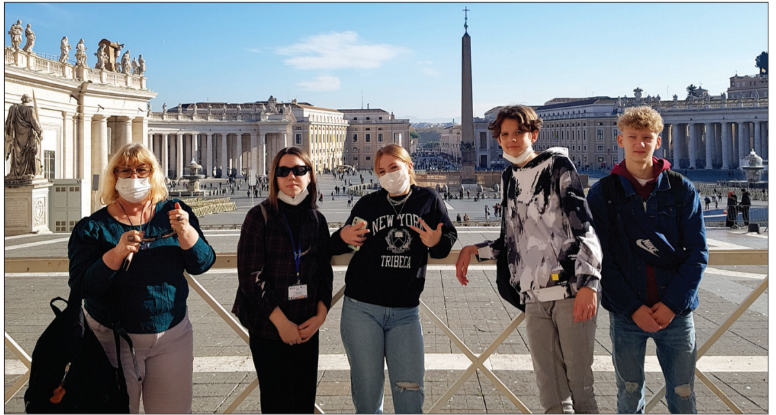
Romas apskate, viesojoties Itālijā, aizputniekiem bija neaizmirstams piedzīvojums.

"Best" projektā darbojas sešas dalībvalstis - Bulgārija, Itālija, Spānija, Grieķija, Lielbritānija un Latvija. Aizputes vidusskolēni pirms pandēmijas sākuma devās uz Spāniju, savukārt šī gada oktobrī visi projekta dalībnieki virtuāli pulcējās Bulgārijā. Iespēja piedalīties "Erasmus+" projektos ir liels atbalsts skolēnu kompetenču izglītībā.