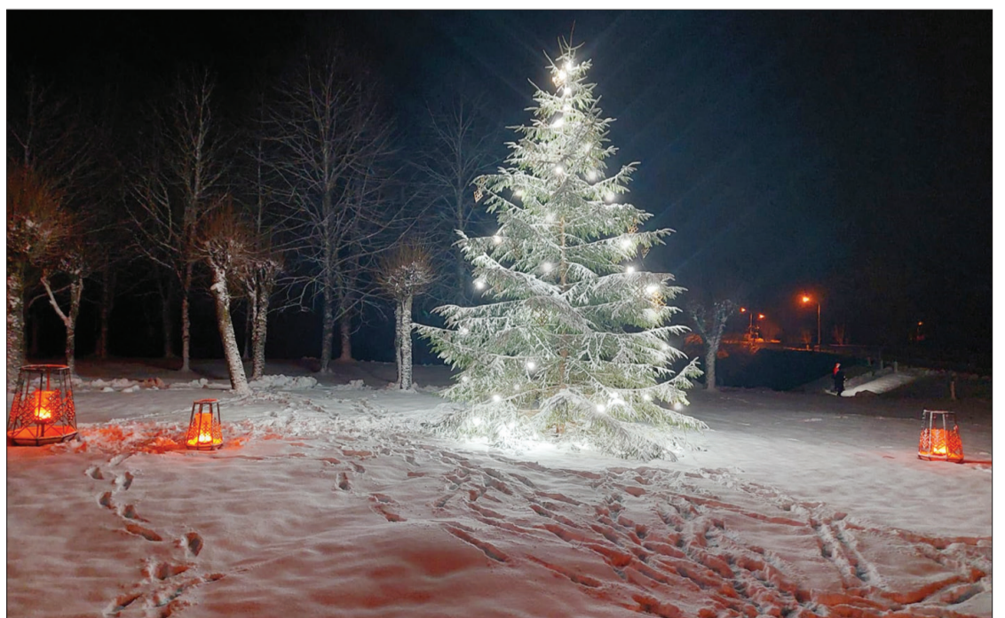
Pāvilostas Simtgades parkā ceļu līdz eglītei rāda sarkanas gaismiņas.