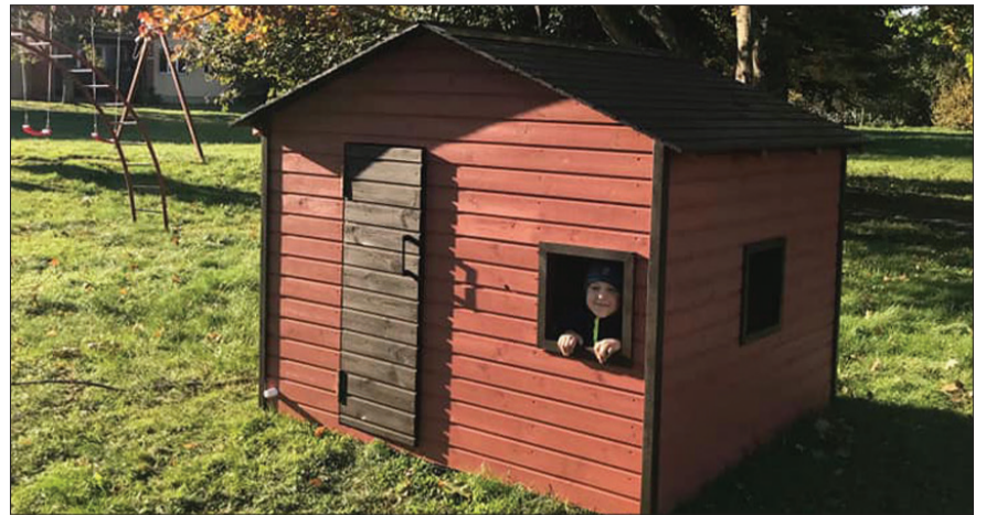
Biedrība “Dārza 4” projektā “Rotaļu namiņš” iepriekš labiekārtoto bērnu rotaļu laukumu papildināja ar rotaļu namiņu.

Nīcas pagasta “Upeskrastos” pie Bārtas upes atjaunotās kāpnes izmantos gan Nīcas airēšanas skolas jaunie airētāji ar savu treneri, gan arī vietējie iedzīvotāji, laivotāji un Nīcas pagasta ciemiņi.