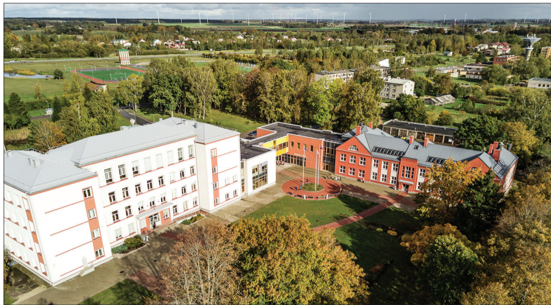
Zentas Mauriņas Grobiņas vidusskola ir izglītības iestāde, kur visiem kopā augt un nobriest kā personībām.

Šajā mācību gadā Zentas Mauriņas Grobiņas vidusskolu par savu sauc 910 skolēni, 118 pedagogi un 39 tehniskā personāla darbinieki. Ik rītu un pēcpusdienu nodrošinām piecus skolēnu autobusu maršrūtus – Bārtas, Gaviezes, Dubeņu, Kapsēdes un Dunalkas virzienos. Mēs esam skola, kuras misija saklausāma, saredzama un sadzirdama vārdā KATRAM (Kvalitāte, Atbildība, Tālredzība, Reālā dzīve, Arodizglītība, Metodiskais centrs), jo mēs nodrošinām kvalitāti un konkurētspēju, augsti vērtējam ikviena atbildību, esam tālredzīgi un sasaistē ar reālo dzī-