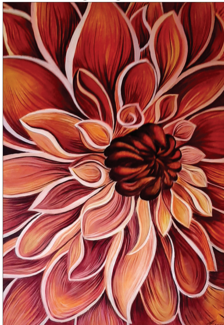
"Dālija" – tik skaista!