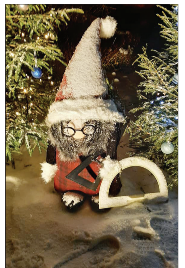
Durbes centrs neparasti pārvērties – izgaismotās vietās paslēpušies 40 dažādi rūķi un rūķēni.