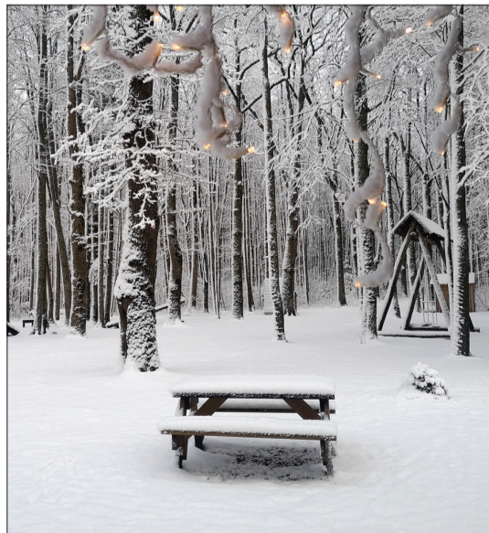
Kalētu “Priediena” parkā piedzīvojumus atradīs gan mazie, gan lielie ziemas prieku baudītāji.

Saliec savu maršrutu: vienu dienu dodies uz Rucavu-Bernātiem-Nīcu, nākamajā dienā Grobiņu-Kapsēdi-Ziemupi-Vērgali (kur muižas parkā sacelti gan dažāda izmēra sniegavīri, gan briedis ar sarkano degunu atskrējis, bet muižas komplekss iemirdzas ko-