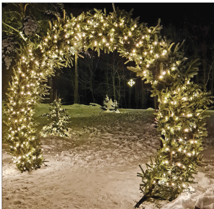
Medzes pagastā pie kultūras nama, izejot cauri izgaismotai egļu arkai, nonākam teiksmaini mirdzošā valstībā.