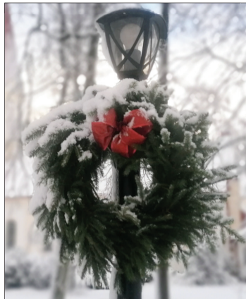
Rucavā pie laternu stabiem uzstādīti Adventes vainagi.

Nīcas centrā ilgu gadu slējās liela un skaista egle, kura tradi-