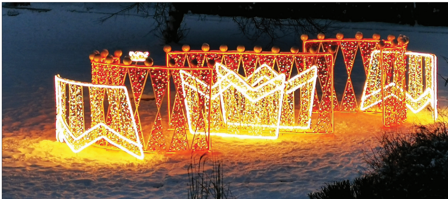
Nīcas zīļu vainags – viena no skaistākajām tautastērpa detaļām – kā stilizēts gaismas elements tagad rotā Nīcas pagasta centru un atgādina par šī vainaga izcelsmi un praktisko izmantojumu.

Pateicoties mūsdienīgu tehnoloģiskajām iespējām, kas piedāvā dažādus risinājumus, ir iespēja veidot lielus, ievērojamas gaismas objektus, aizstājot pierastās krāsainās lampiņu virtenes. Ar skatu nākotnē Nīcas Kultūras centrs plāno uzstādīt gaismas elementus gan Nīcas, gan Otaņķu pagastos, veidojot vienotu vizuālo konceptu ar nosaukumu "Nīcas zīļu vainags