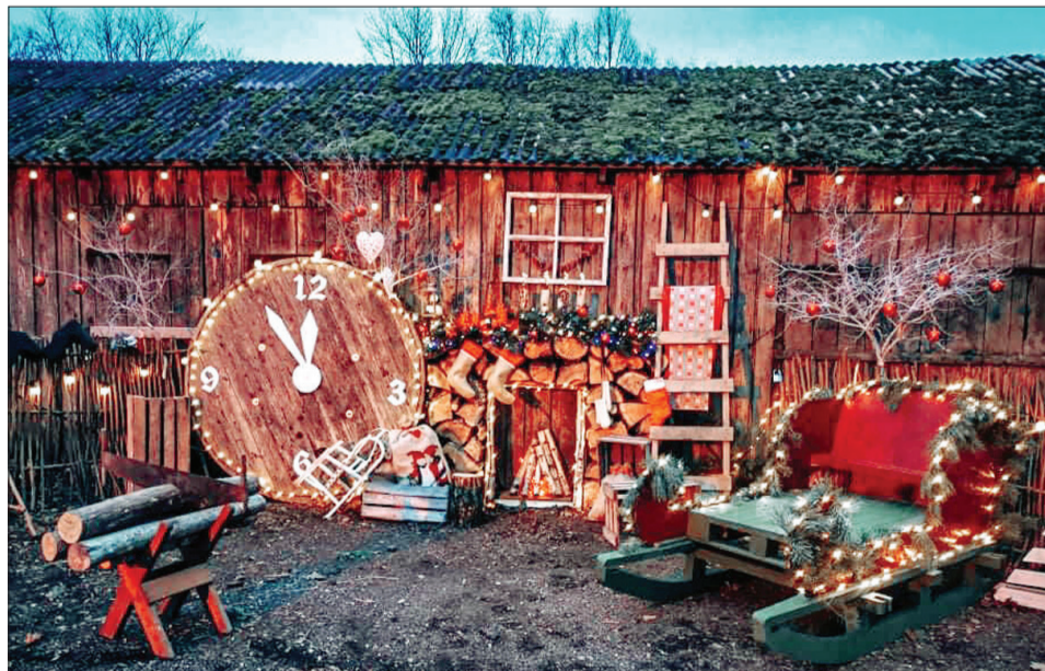
Priekules pusē Ziemassvētku Šeptes Brīnumskolā ciemos gaida Rūķome kaudzi pašceptām piparkūkām un citām aizraujošām izklaidēm.

Par visu vairāk var uzzināt: www.dienvidkurzeme.travel .