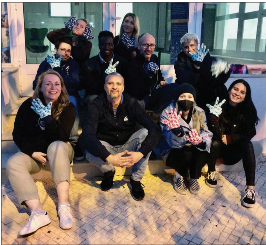
Viesošanās Portugālē "IDEJU MĀJAS" jauniešiem bija vērtīgs papildinājums jau iesāktajiem projektiem.

Šā gada sākumā Aizputes jauniešu "IDEJU MĀJAS" komanda kā vieni no projekta partneriem uzsāka dalību "Erasmus+" stratēģiskās partnerības projektā "Community Challengers: Towards sustainable & climate smart communities through Arts & Social entrepreneurship" (Kopienas izaicinātāji: Ceļā uz ilgtspējīgām un klimatgudrām kopienām caur mākslu un sociālo uzņēmējdarbību).