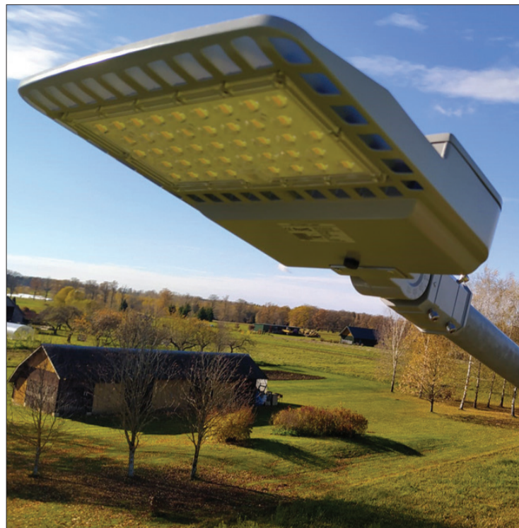
Bijušā Priekules novada teritorijā nomainīti vecie, neefektīvie nātrija un dzīvsudraba gaismekļi pret jauniem un moderniem LED gaismekļiem.

Novembrī pabeigti ielu apgaismojuma modernizācijas darbi: uzstādītas jaunas, modernas LED ielu apgaismojuma lampas, kas padarīja ielas ne tikai gaišākas, bet arī drošākas. Rezultātā uzlabots apgaismojuma vienmērīgums, apgaismoju-