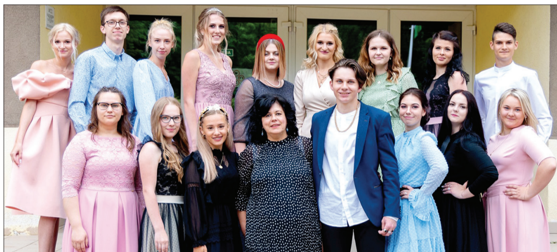
Vidusskolu Vaiņodē šogad absolvēja 17 jaunieši.