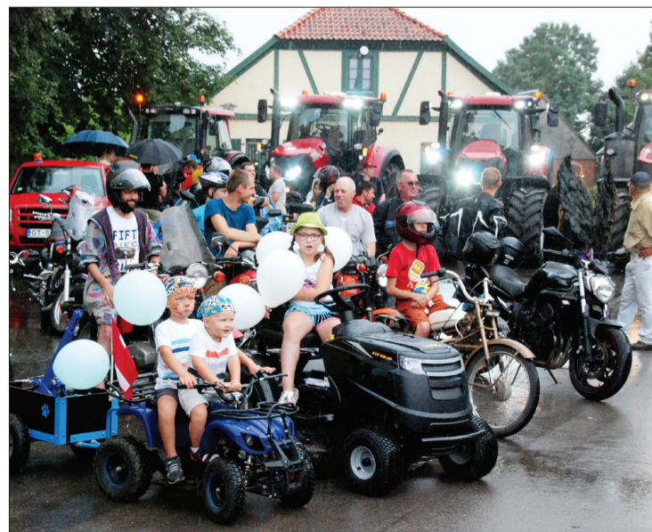
Dažādu transportlīdzekļu parāde vienmēr pieviliina daudz skatītāju.