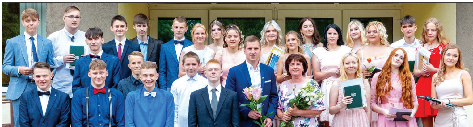
Apliecību par pamatzglītību saņēma 28 Vaiņodes vidusskolas 9. klases skolēni.

Vaiņodes vidusskolas direktora vietniece