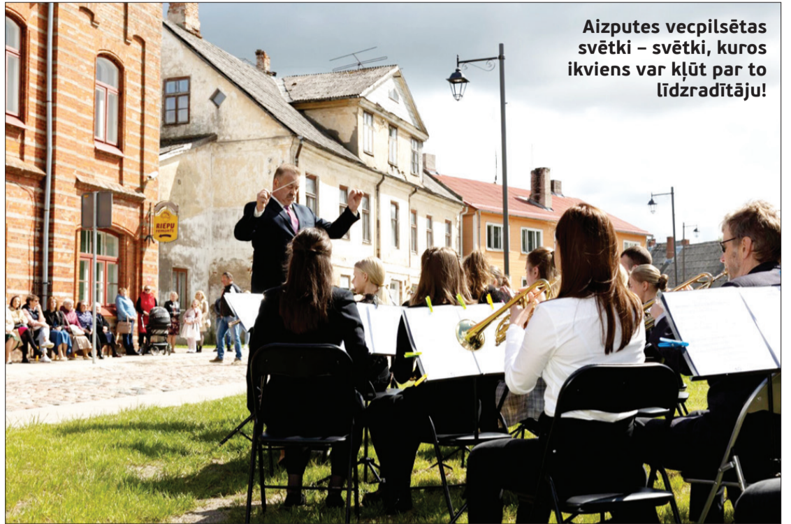
Aizputes vecpilsētas svētki – svētki, kuros ikviens var kļūt par to līdzradītāju!

Pasākumu organizē Dienvidkurzemes novada pašvaldības kultūras pārvalde sadarbībā ar Aizputes Renesanses biedrību.