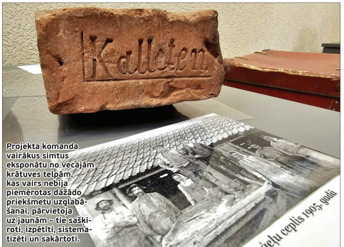
Projekta komanda vairākus simtus eksponātu no vecajām krātuves telpām, kas vairs nebija piemērotas dažādo priekšmetu uzglabāšanai, pārvietoja uz jaunām – tie sašķiroti, izpētīti, sistematizēti un sakārtoti.

Turpmāk Kalētu senlietu krātuve būs aplūkojama pēc iepriekšējas pieteikšanās, zvanot 26197828.