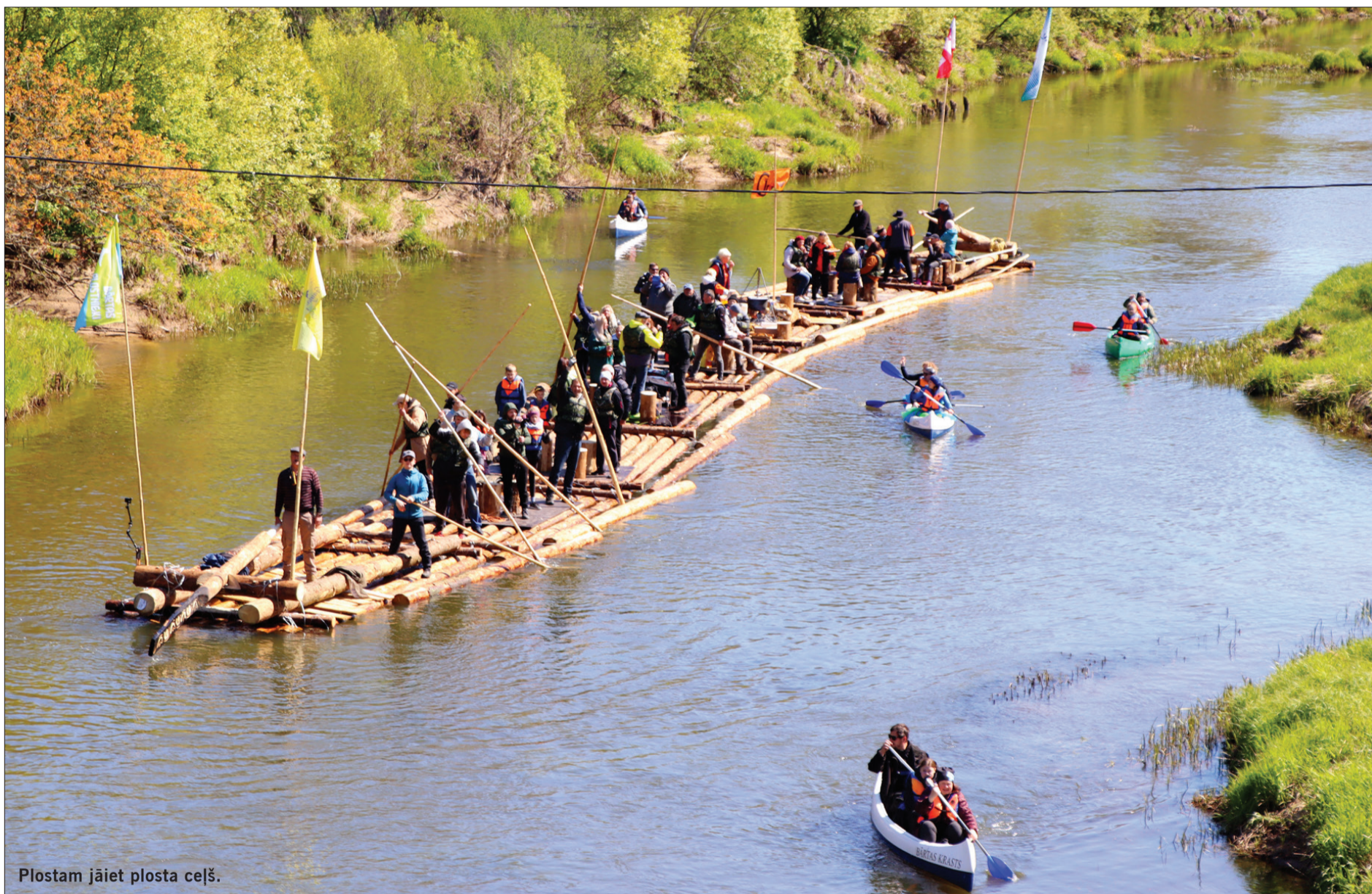
Plostam jāiet plostā ceļš.

Turpinot iesākto tradīciju, 3. un 4. maijā Bārtā notiks “Bārtas plostnieku svētki 2025”. Tas būs divu dienu pasākums, kas apvienos vēsturisko mantojumu, dzīvas tradīcijas un īstu latviskuma garu.