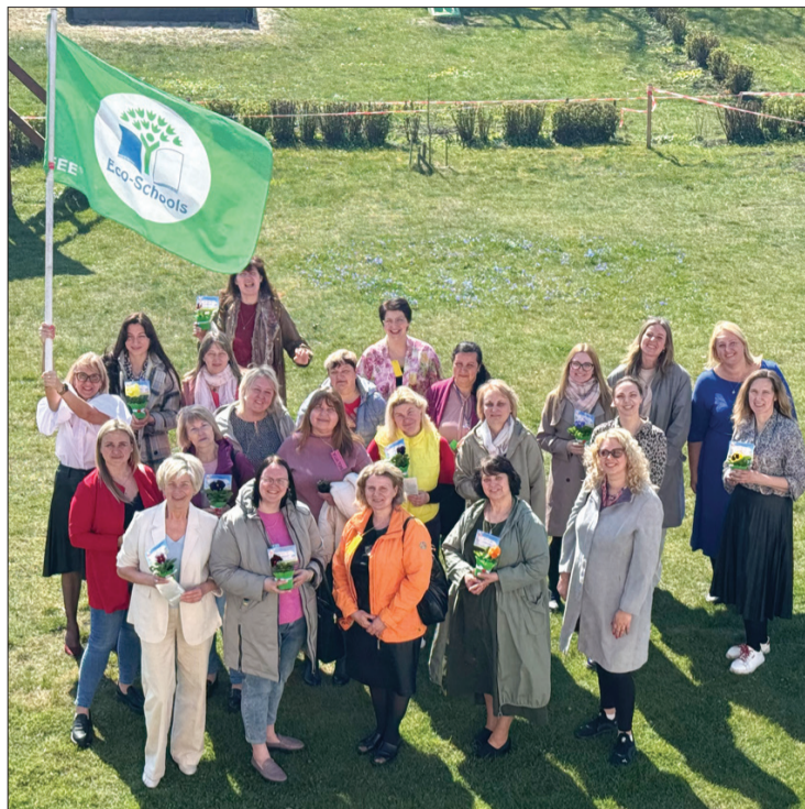
Dienvidkurzemes novada pirmsskolas pedagogi un iestāžu vadītāju vietnieki pulcējās "Spārītē", lai iepazītos ar tās labo praksi un pieredzi.

15. aprīlī Nīcas PII "Spārīte" organizēja Dienvidkurzemes novada pirmsskolas izglītības iestāžu pe-