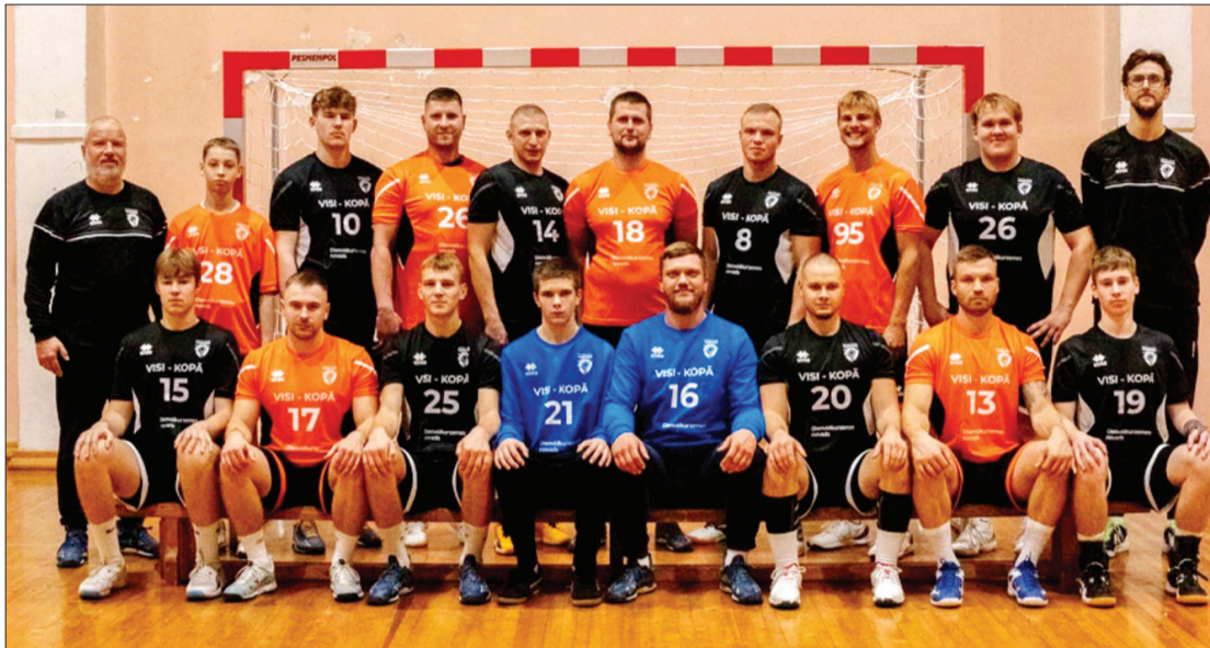
HK "Vaiņode" ir viena no jaunākajām komandām līgā ar vidējo vecumu nepilni 23 gadi. Vecākajam spēlētājam ir 34 gadi, bet jaunākajiem 15 gadi (6 spēlētāji).

HK "Vaiņode" SynotTīp virslīgas sezonu noslēdza 6. vietā ar 3 uzvarām un 14 zaudējumiem.