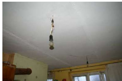
Būve ar kadastra apzīmējumu 6452 012 0094 001, dzīvoklis Nr.1, telpa Nr.4