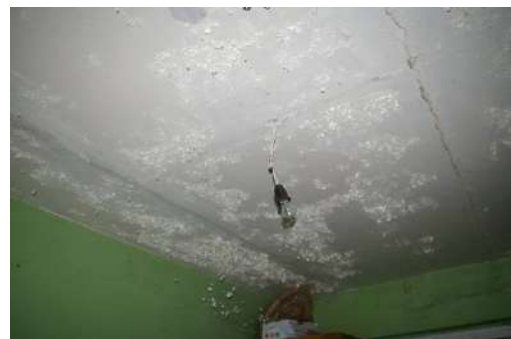
Būve ar kadastra apzīmējumu 6452 012 0094 001, dzīvoklis Nr.1, telpa Nr.5