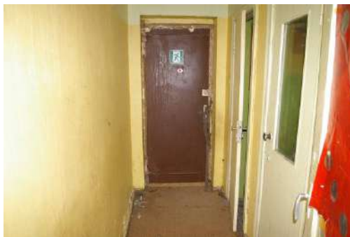
Būve ar kadastra apzīmējumu 6452 012 0094 001, dzīvoklis Nr.1, telpa Nr.1