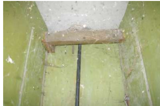
Būve ar kadastra apzīmējumu 6452 012 0094 001, dzīvoklis Nr.1, telpa Nr.6