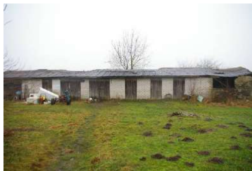
Būve ar kadastra apzīmējumu 6452 012 0094 004, Būve ar kadastra apzīmējumu 6452 012 0094 005 un Būve ar kadastra apzīmējumu 6452 012 0094 006