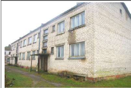
Būve ar kadastra apzīmējumu 6452 012 0094 001