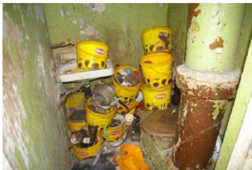
Būve ar kadastra apzīmējumu 6452 012 0094 001, dzīvoklis Nr.1, telpa Nr.7