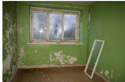
Būve ar kadastra apzīmējumu 6452 012 0094 001, dzīvoklis Nr.1, telpa Nr.5