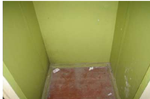
Būve ar kadastra apzīmējumu 6452 012 0094 001, dzīvoklis Nr.1, telpa Nr.3