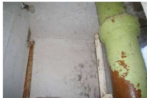
Būve ar kadastra apzīmējumu 6452 012 0094 001, dzīvoklis Nr.1, telpa Nr.7