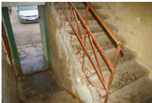
Būve ar kadastra apzīmējumu 6452 012 0094 001, koplietošanas telpa