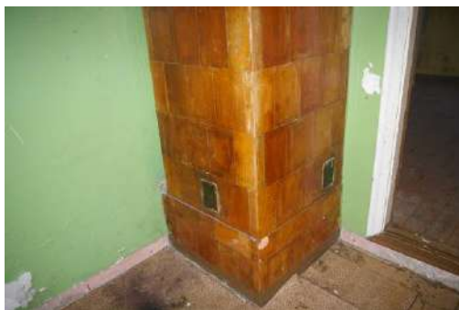
Būve ar kadastra apzīmējumu 6452 012 0094 001, dzīvoklis Nr.1, telpa Nr.5, krāsns