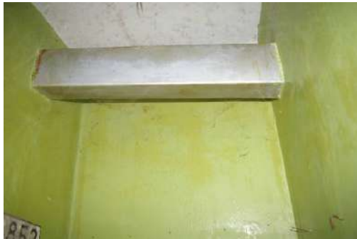
Būve ar kadastra apzīmējumu 6452 012 0094 001, dzīvoklis Nr.1, telpa Nr.2