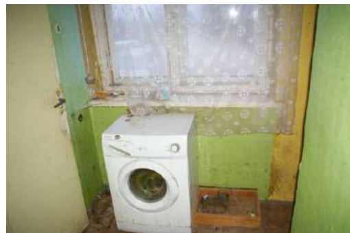
Būve ar kadastra apzīmējumu 6452 012 0094 001, dzīvoklis Nr.1, telpa Nr.4