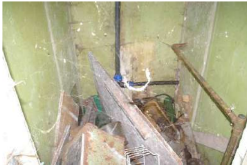
Būve ar kadastra apzīmējumu 6452 012 0094 001, dzīvoklis Nr.1, telpa Nr.6