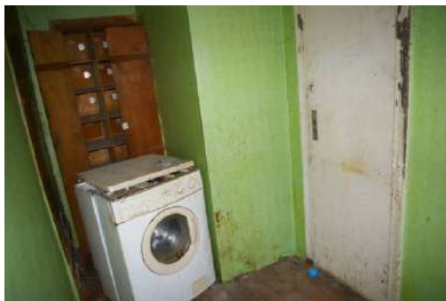
Būve ar kadastra apzīmējumu 6452 012 0094 001, dzīvoklis Nr.1, telpa Nr.4