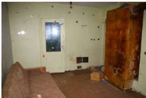
Būve ar kadastra apzīmējumu 6452 012 0094 001, dzīvoklis Nr.1, telpa Nr.4