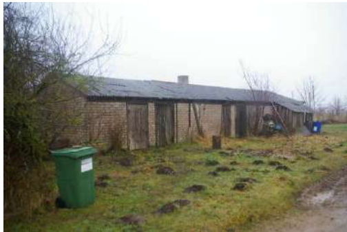
Būve ar kadastra apzīmējumu 6452 012 0094 002