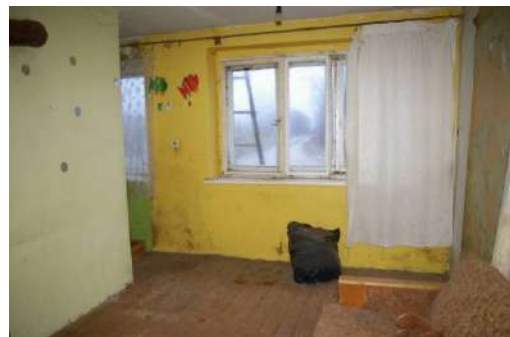
Būve ar kadastra apzīmējumu 6452 012 0094 001, dzīvoklis Nr.1, telpa Nr.4