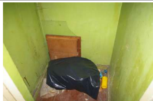
Būve ar kadastra apzīmējumu 6452 012 0094 001, dzīvoklis Nr.1, telpa Nr.2