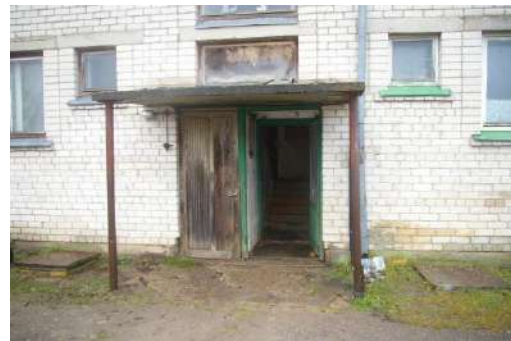
Būve ar kadastra apzīmējumu 6452 012 0094 001