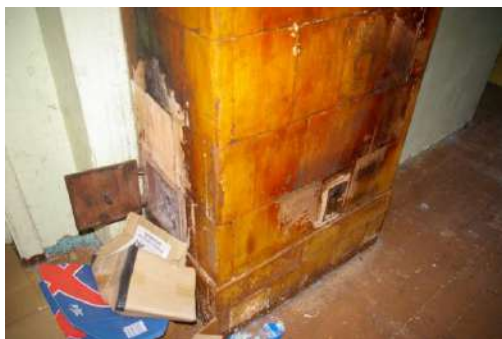
Būve ar kadastra apzīmējumu 6452 012 0094 001, dzīvoklis Nr.1, telpa Nr.4, krāsns