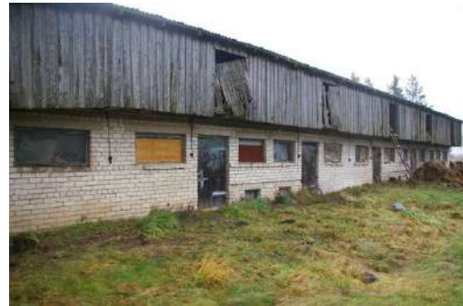
Būve ar kadastra apzīmējumu 6452 012 0094 003