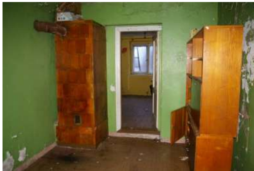
Būve ar kadastra apzīmējumu 6452 012 0094 001, dzīvoklis Nr.1, telpa Nr.5