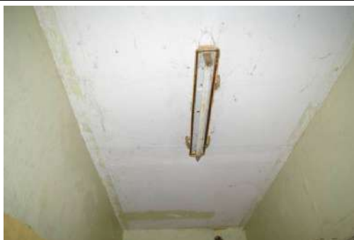
Būve ar kadastra apzīmējumu 6452 012 0094 001, dzīvoklis Nr.1, telpa Nr.1