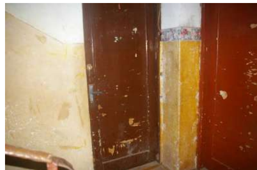
Būve ar kadastra apzīmējumu 6452 012 0094 001, dzīvoklis Nr.1