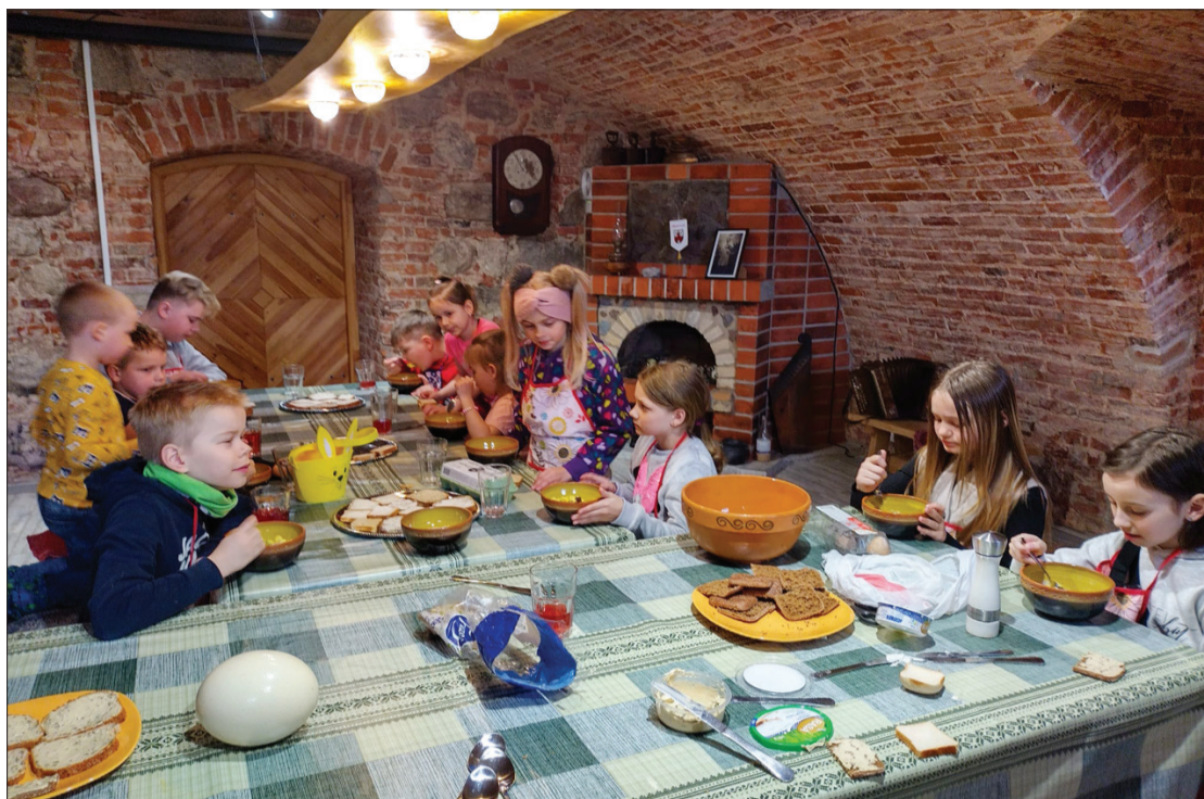
Pirmajā nodarbībā bērni pašu pagatavoto olu kulteni notiesāja ar kāru muti.

Aizputes novadpētniecības muzeja muzejpedagoģe