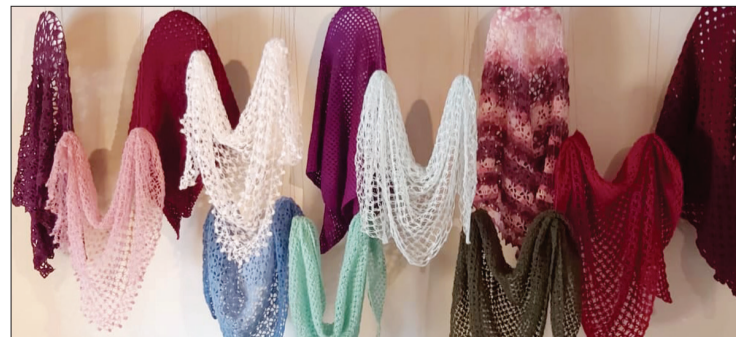
Studijas dalībnieču radītie lakati pārsteidz ne tikai ar krāsu daudzveidību, bet arī ar dažādajām tehnikām, kādās rokdarbi radīti.

Izstāde apskatāma Bārtas muzeja darba laikā: darbdienās no plkst. 10.00 līdz 16.00, sestdienās, svētdienās no plkst. 11.00 līdz 16.00.