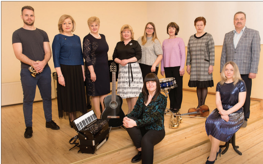
Aizputes Mūzikas skolas pedagogi paši mīl mūziku un māca to iemīlēt arī saviem audzēkņiem.