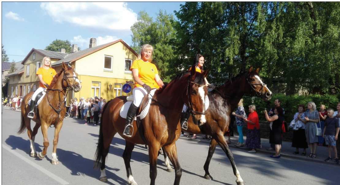
Grobiņas svētku gājiens vienmēr bijis ļoti atraktīvs, un noteikti tāds tas būs arī šoreiz.

Gājienā vizuālo noformējumu lūgums veidot atbilstoši vārdam “Prieks”.