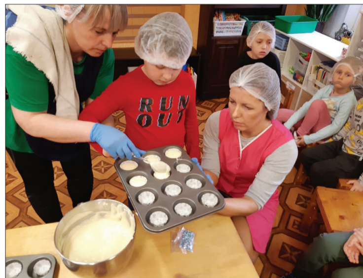
Svētkos ir jābūt gardiem cienastiem. Bērniem tos palīdzēja sagatavot virtuves labie gariņi.

sākums darbiniekiem, kurā ar koncertu viesojās mūsu bijušie audzēkņi un viņu pedagogi no Vai-