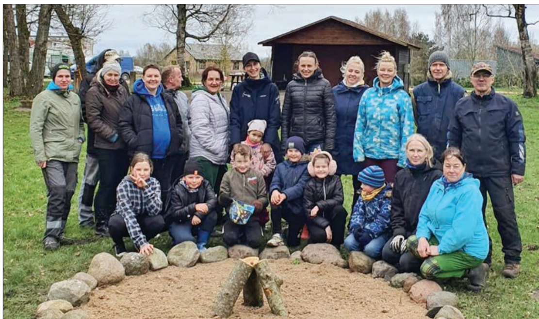
Biedrības pārstāvji talko Otaņķos.

tātēm veicinām vietējās sabiedrības kopības sajūtu. Kas var būt vēl labāks, ja to visu var paveikt kopā ar līdzīgi domājošiem cilvēkiem.