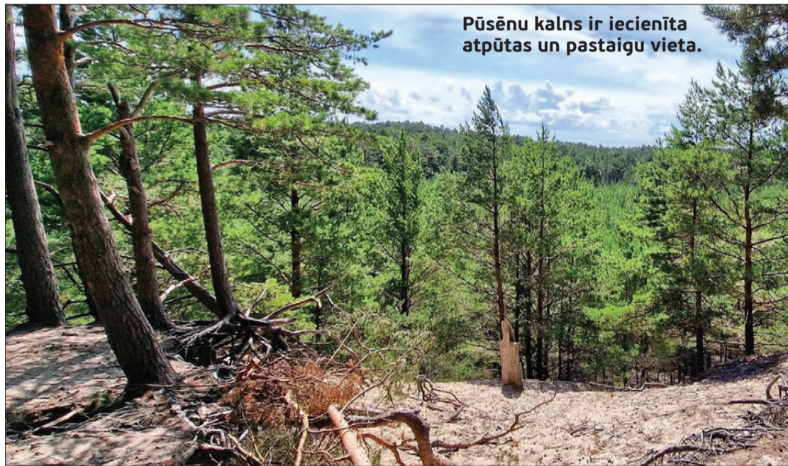
Pūsēnu kalns ir iecienīta atpūtas un pastaigu vieta.

Latvijas Universitātes Eksakto zinātņu un tehnoloģiju fakultātes Ģeoloģijas nodaļa un Ģeogrāfijas nodaļa par 2025. gada ģeovietu nosaukusi Pūsēnu kalnu Nīcas pagastā.