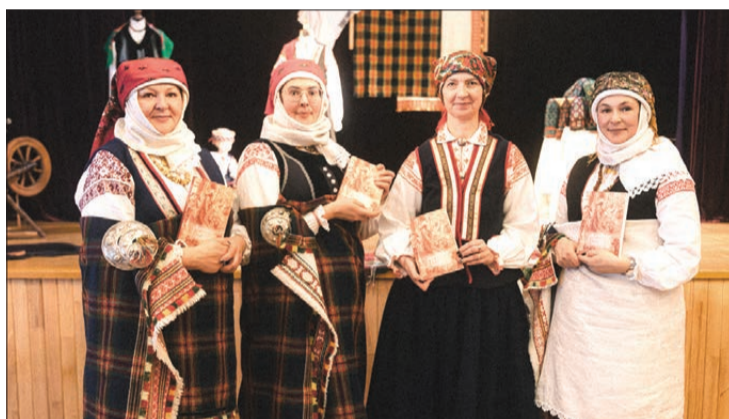
Biedrības "Rucavas tradīciju klubs" pārstāves grāmatas "Rucavas sievu stāsti" atklāšanā.

M. Horna: – Pēc iespējas vairāk iesaistīt iedzīvotājus biedrības organizētajos pasākumos, tā ļaujot viņiem justies piederīgiem un līdzatbildīgiem. Jaunībā gūta pieredze sabiedriskajā darbībā bieži vien veicina aktīvu dzīves pozīciju nākotnē. Un, protams, dalīties un informēt par savām aktivitātēm digitālajā vidē un