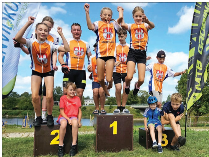
"Priekules velokluba" rīkotās velo sacensības.

Šo gadu laikā esam iesnieguši projektu pieteikumus vairākos biedrības "Liepājas rajona partnerība" izsludinātajos projektu konkursos un tos arī realizējuši: esam iegādājušies sporta rezul-