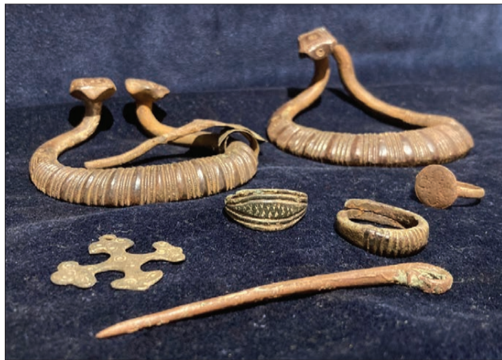
Šī gada janvārī Aizputes muzejā nonāca sainītis ar 12.–14. gs. kuršu ugunskaņos iegūtiem arheoloģiskiem priekšmetiem.