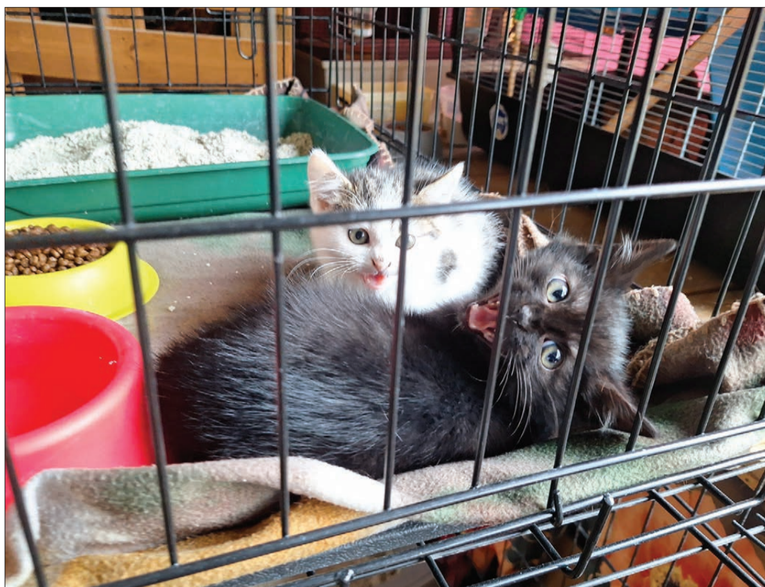
"Liberta" sniedz otru iespēju katrai pamestai ķepai, kas ienāk viņu biedrībā.

Dzīvnieka adopcija ir liela atbildība, tāpēc potenciālos adoptētājus rūpīgi izvērtē. Pirms savās mājās uzņem jaunū iemītnieku, biedrība pārliedzinās, ka