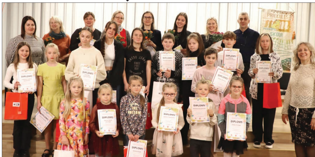
Dalībnieki vecumā no 5 līdz 16 gadiem darbus konkursam iesūtīja četrās kategorijās: zīmēšana, gleznošana, trīsdimensija un datorgrafika.

Šogad konkursa tēma izvēlēta "Lidotāju rotaļlietas", kas mudināja dalībniekus izpētīt rotaļlietas no 17. gadsimta līdz mūsdienām, atspoguļojot aviācijas un lidrojuma tematiku dažādās mākslas formās. Konkursa dalībnieki varēja piedalīties