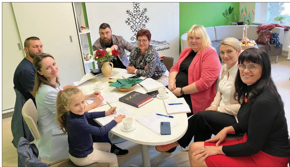
Zentas Mauriņas Grobiņas vidusskolā jau vairākkārt tikusies saieta rīkotāju darba grupa un Dienvidkurzemes novada pašvaldības speciālisti.

Nākamgad no 29. jūnija līdz 6. jūlijam Grobiņā – senākajā rakstos precīzi norādītajā apdzīvotajā vietā Latvijas teritorijā – norisināsies pasaules latviešu kustības “3x3” pirmais 2025. gada saiets.