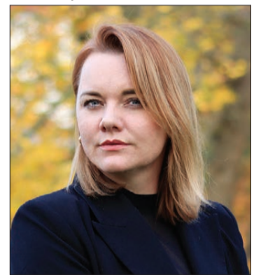
L. Jučere norāda, ka pirmais darbs jaunajā amatā būs apsektot visas novada filiālbibliotēkas un iepazīt to darbiniekus, lai uzklautu, kādas ir nepieciešamības bibliotēkās un kā veicas darba pienākumu izpildē.

"Uzskatu, ka veiksmīga bibliotēkas vadība prasa ne tikai organizatoriskas spējas, bet arī spēju iedvesmot un motivēt komandu, kā arī attīstīt radošas un inovatīvas pieejas, lai nodrošinātu kvalitatīvus pakalpojumus sabiedrībai jebkurā pagastā vai pilsētā. Esmu pārliecināta, ka manas prasmes un pieredze šajā jomā ļaus man veiksmīgi īstenot vienu redzējumu un stratēģiskus