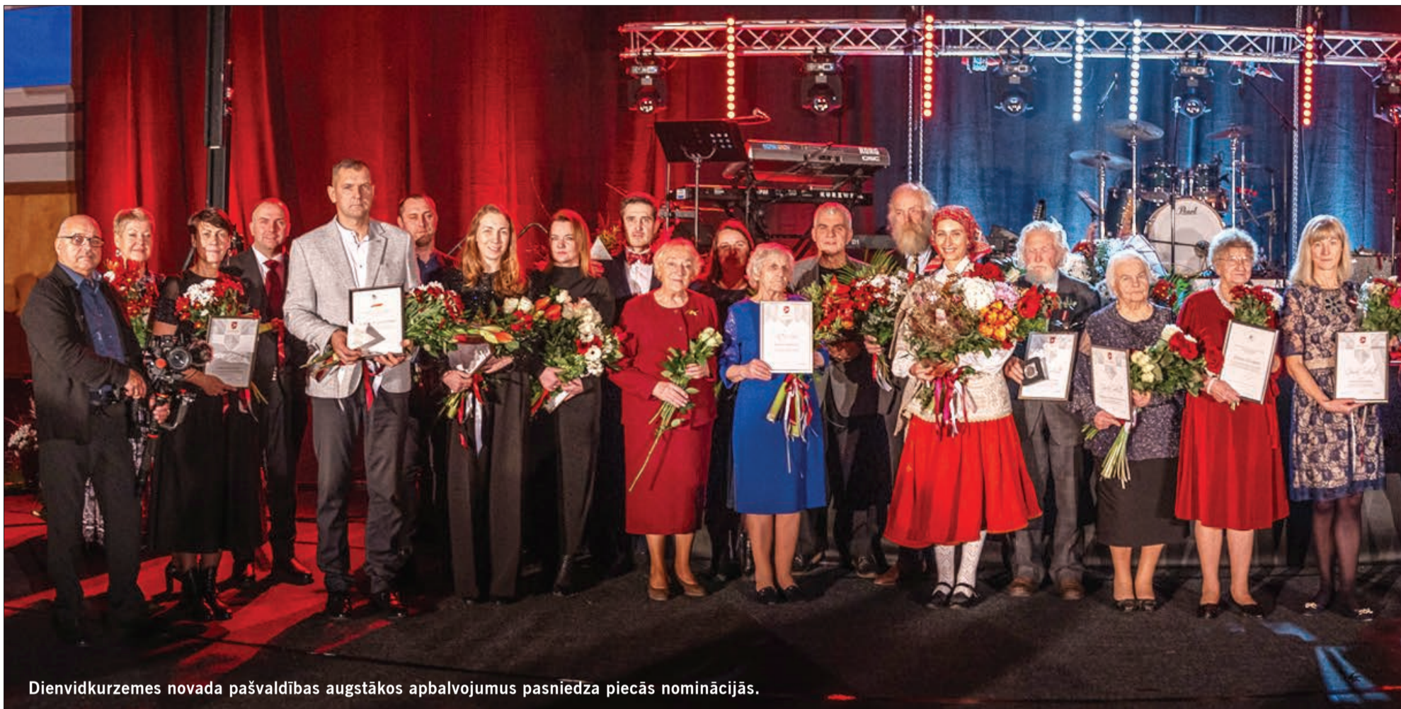
Dienvidkurzemes novada pašvaldības augstākos apbalvojumus pasniedza piecās nominācijās.