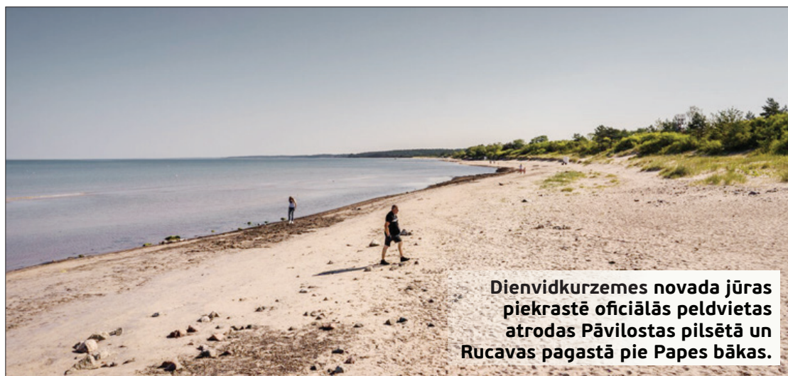
Dienvidkurzemes novada jūras piekrastē oficiālās peldvietas atrodas Pāvilostas pilsētā un Rucavas pagastā pie Papes bākas.

Vasara nav iedomājama bez atspirdzinošām peldēm. Par drošu peldēšanās vietu var uzskatīt tikai oficiālu peldvietu.