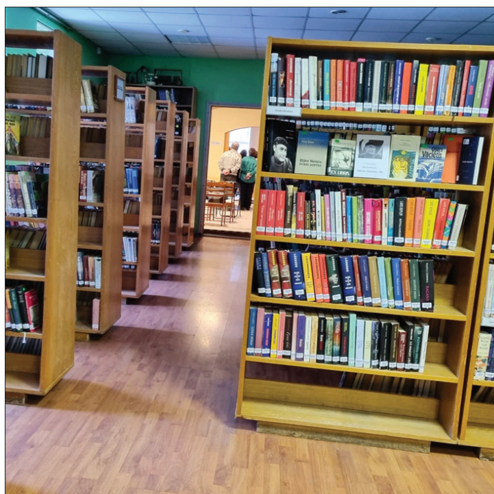
Turpmāk novada filiālbibliotēkas iesaistīsies klientu apkalpošanā un konsultēs iedzīvotājus par pieejamajiem pakalpojumiem.

“Ar šīm pārmaiņām vēlamies nodrošināt pilnvērtīgu darba noslodzi darbiniekiem, celt darbinieku zināšanas, kompetences un atalgojumu, veicināt racionālu pašvaldības resursu un telpu izmantošanu, to apsaimniekošanu. Pašvaldības mērķis ir apvienotās pārvaldes un bibliotēkas attīstīt par multifunkcionāliem atbalsta centriem mūsu iedzīvotājiem, veidot vietu, kur organizēt darba sanāksmes un seminārus, uzzināt novada aktualitātes, baudīt kultūru, veikt norēķinus, saņemt speciālistu konsultācijas, atpūsties un labi pavadīt laiku. Mērķis ir veidot viesmīlīgu, radošu, mūsdienīgu un inovatīvu vidi, kas ir pieejama un saistoša ikvienam – gan jau-