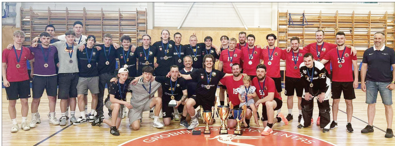
Uz A divīzijas pjedestāla: "Grobiņas SC/Melnis", "Kurzemes gaļsaimeņi" un "Kurši".