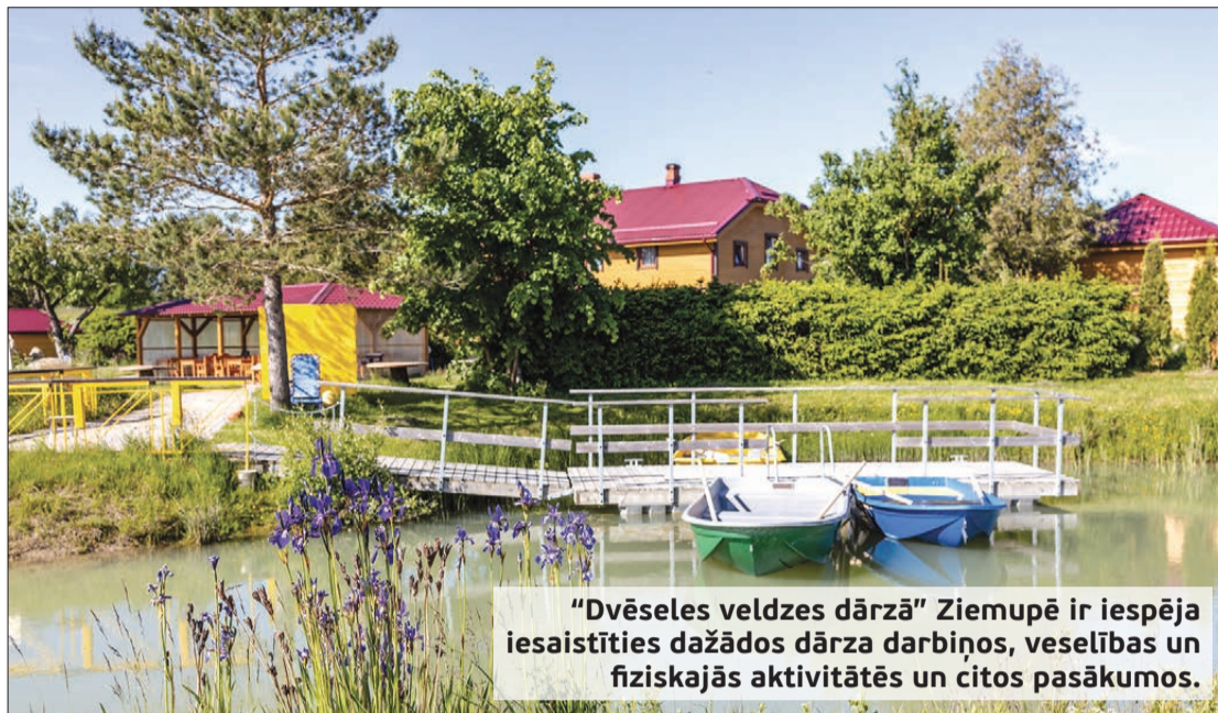
"Dvēseles veldzes dārzs" Ziemupē ir iespēja iesaistīties dažādos dārza darbos, veselības un fiziskajās aktivitātēs un citos pasākumos.