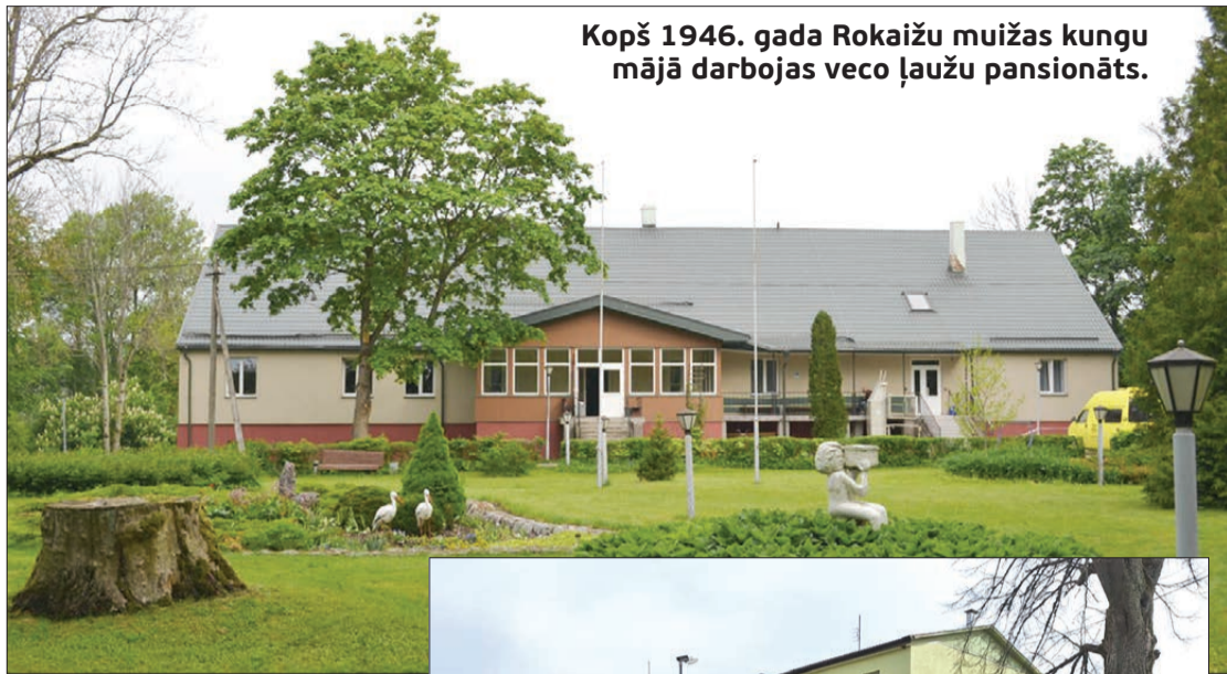
Kopš 1946. gada Rokaižu muižas kungu mājā darbojas veco ļaužu pensionāts.

Kad mūža nogalē senioriem vairs nav iespējams atjaunot fiziskās un garīgās spējas un jādodomā, kā turpmāk rīkoties, atbalstu var sniegt profesionāls personāls, nodrošinot ģimenisku vidi. Šoreiz piedāvājam ieskatu Dienvidkurzemes novada pašvaldības kapitālsabiedrībā, SIA "Pansionāts Rokaiži", kas atrodas Kazdangas pagastā.