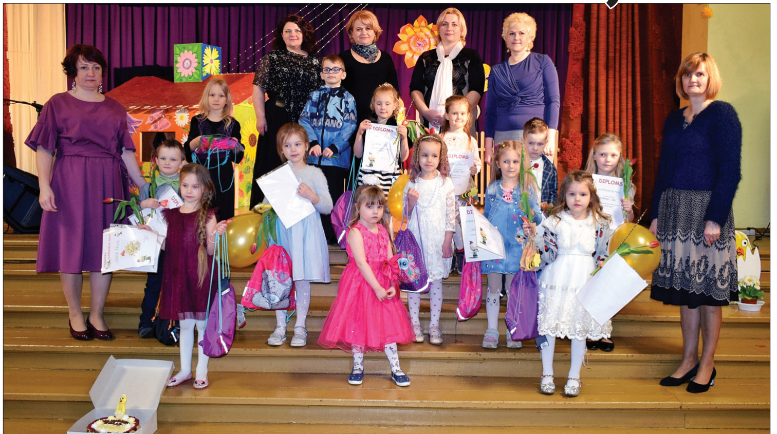
Mazie cāļi nodziedājuši un godalgas sadalījuši.