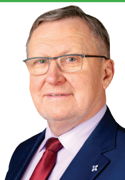
AIVARS PRIEDOLS, Dienvidkurzemes novada domes priekšsēdētājs