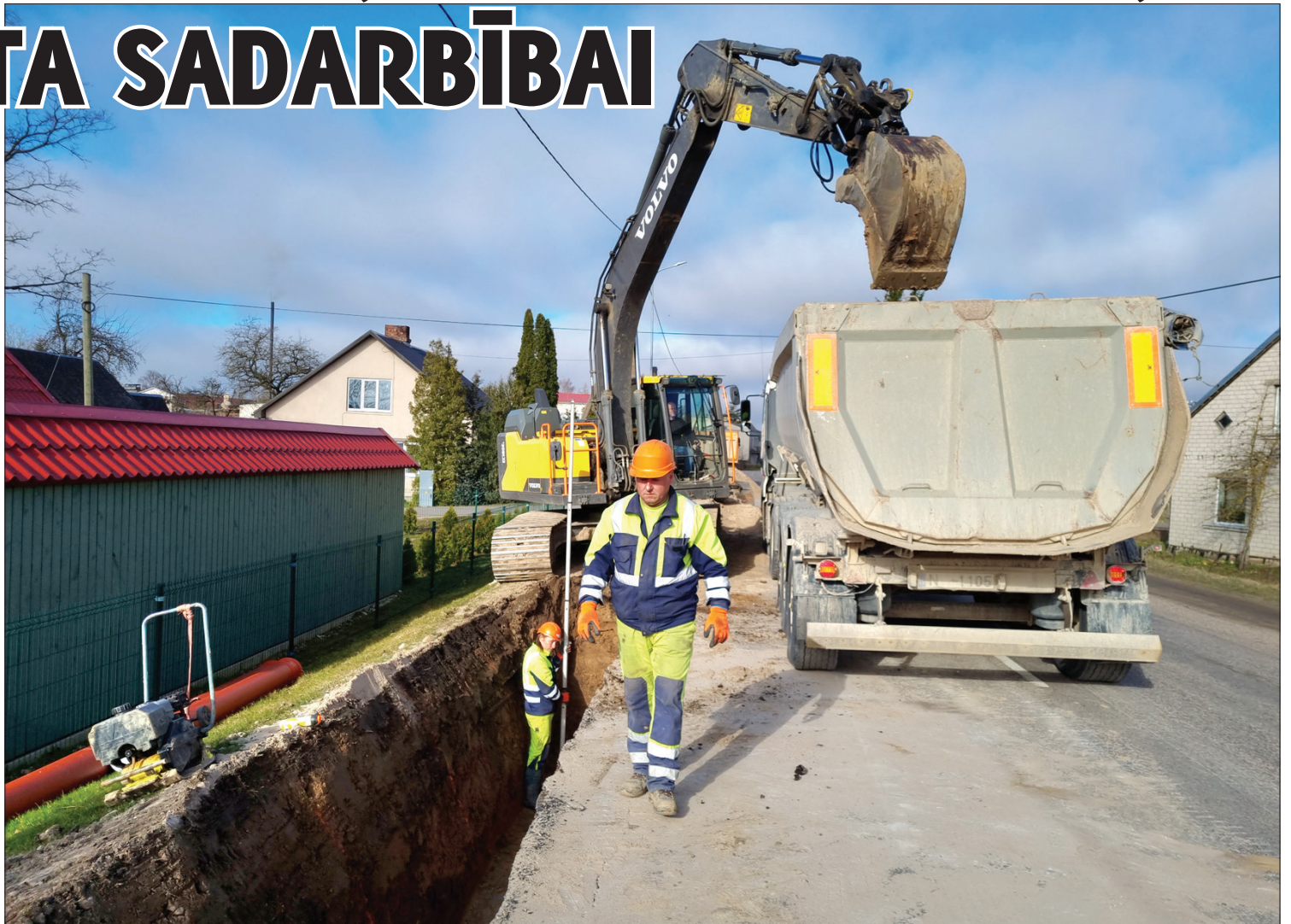
Viens no projektiem šobrīd tiek īstenots Aizputē, kur top gājēju un veloceļa izveide uz peldētavu.