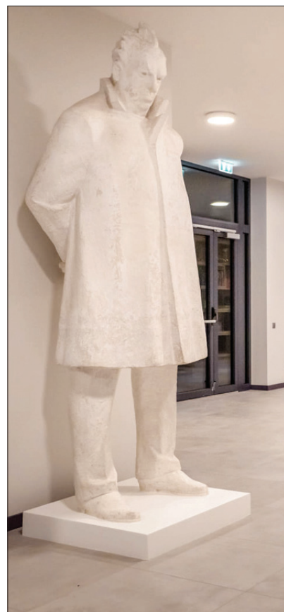
Laiku lokos Emiļa Melngaiļa statuja ir sagaidījusi skolā jaunus mūziķus.

PIKC Liepājas Mūzikas, mākslas un dizaina vidusskolai (LMMDV) 2022. gads sācies nozīmīgu jubileju atzīmēšanas zīmē. Leģendārajai Melngaiļskolai šogad aprit 100 gadi, bet Mākslas vidusskolai pērn rudenī – 95 gadu jubileja. Centrālais kopīgais notikums plānots 8. jūlijā, kad uz vērienīgu salidojumu gan skolas telpās, gan atjaunotajā koncertdārzā "Pūt, vējiņi!" pulcēsies skolu absolventi, bijušie un esošie darbinieki.