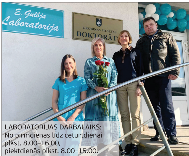
LABORATORIJAS DARBALAIKS: No pirmdienas līdz ceturtdienai plkst. 8.00–16.00, piektdienās plkst. 8.00–15.00.

Asins analīzes veic arī pie klientiem mājās. Vīzīti lūgums iepriekš pieteikt pa tālruni 26645998.