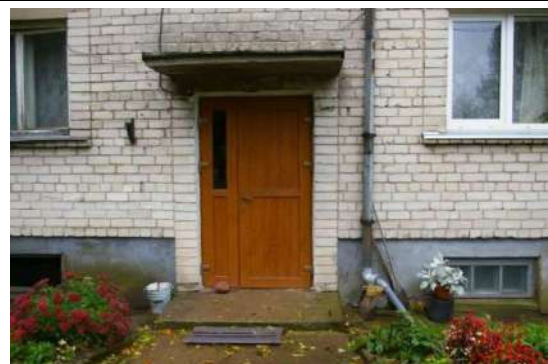
Būve ar kadastra apzīmējumu 6454 004 0080 001