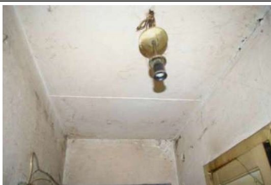
Būve ar kadastra apzīmējumu 6454 004 0080 001, dzīvoklis Nr.9, telpa Nr.1