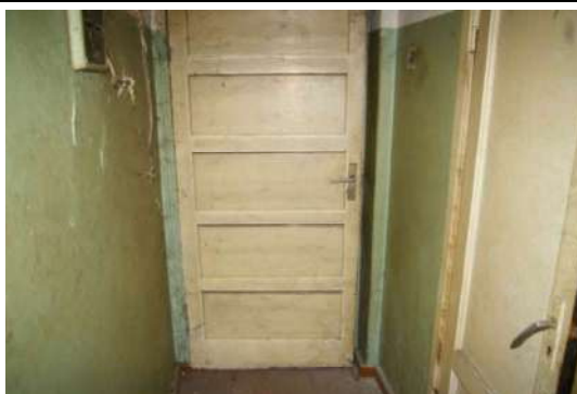
Būve ar kadastra apzīmējumu 6454 004 0080 001, dzīvoklis Nr.9, telpa Nr.1