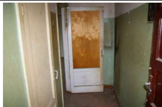
Būve ar kadastra apzīmējumu 6454 004 0080 001, dzīvoklis Nr.9, telpa Nr.1