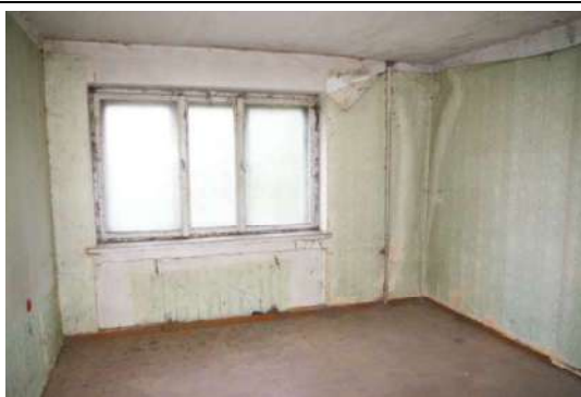
Būve ar kadastra apzīmējumu 6454 004 0080 001, dzīvoklis Nr.9, telpa Nr.4