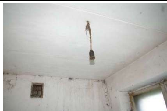
Būve ar kadastra apzīmējumu 6454 004 0080 001, dzīvoklis Nr.9, telpa Nr.3