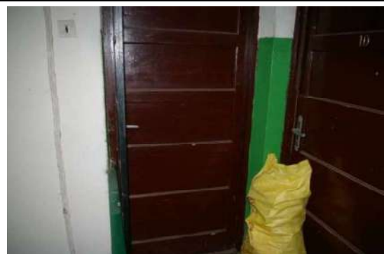
Būve ar kadastra apzīmējumu 6454 004 0080 001, dzīvoklis Nr.9