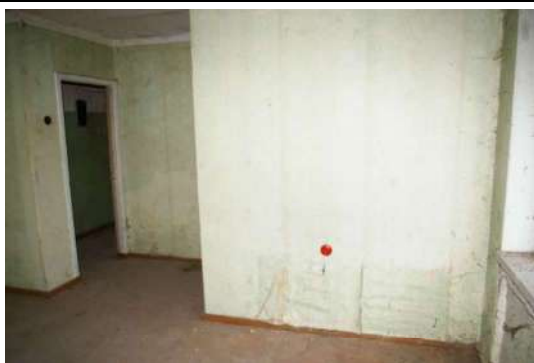
Būve ar kadastra apzīmējumu 6454 004 0080 001, dzīvoklis Nr.9, telpa Nr.4