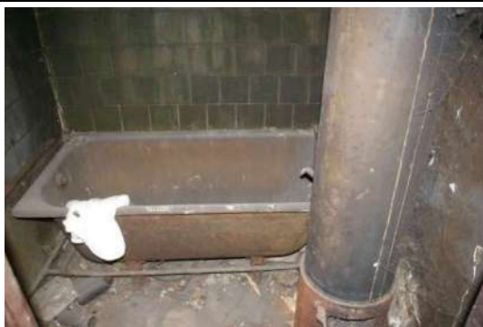
Būve ar kadastra apzīmējumu 6454 004 0080 001, dzīvoklis Nr.9, telpa Nr.2