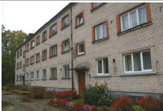
Būve ar kadastra apzīmējumu 6454 004 0080 001