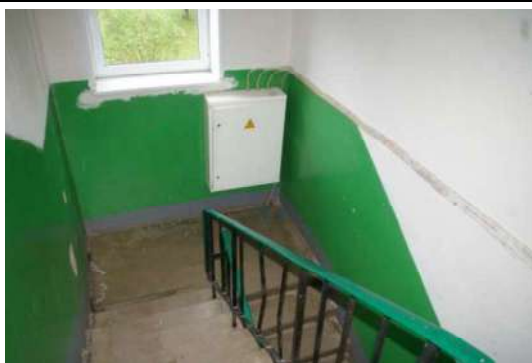
Būve ar kadastra apzīmējumu 6454 004 0080 001, koplietošanas telpa