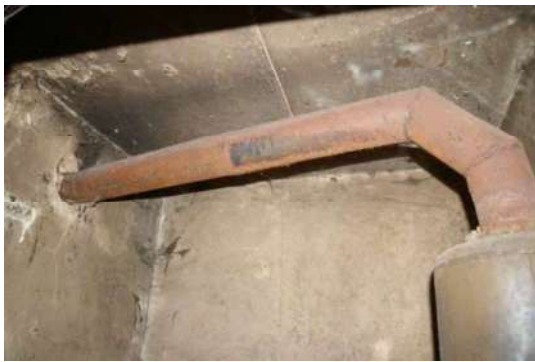
Būve ar kadastra apzīmējumu 6454 004 0080 001, dzīvoklis Nr.9, telpa Nr.2