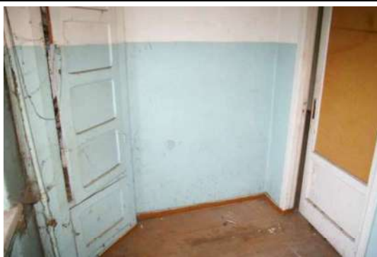
Būve ar kadastra apzīmējumu 6454 004 0080 001, dzīvoklis Nr.9, telpa Nr.3