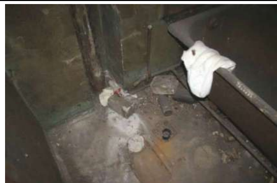
Būve ar kadastra apzīmējumu 6454 004 0080 001, dzīvoklis Nr.9, telpa Nr.2