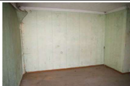
Būve ar kadastra apzīmējumu 6454 004 0080 001, dzīvoklis Nr.9, telpa Nr.4