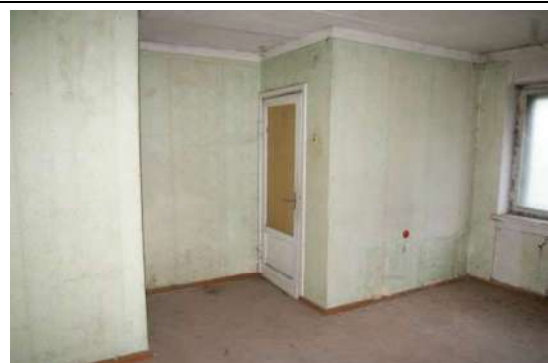
Būve ar kadastra apzīmējumu 6454 004 0080 001, dzīvoklis Nr.9, telpa Nr.4