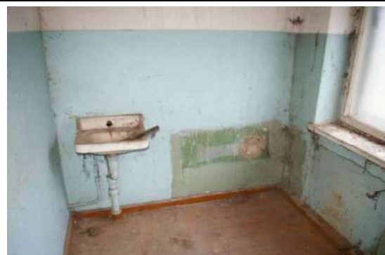
Būve ar kadastra apzīmējumu 6454 004 0080 001, dzīvoklis Nr.9, telpa Nr.3