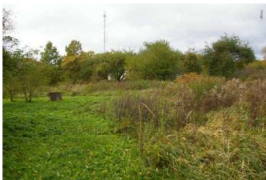
Zemes vienība ar kadastra apzīmējumu 6415 001 0100