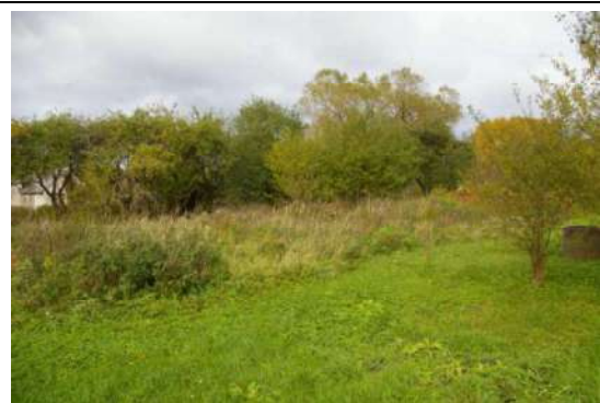
Zemes vienība ar kadastra apzīmējumu 6415 001 0100