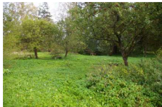
Zemes vienība ar kadastra apzīmējumu 6415 001 0100