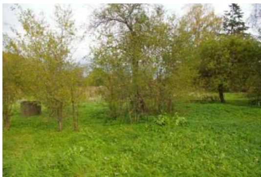
Zemes vienība ar kadastra apzīmējumu 6415 001 0100