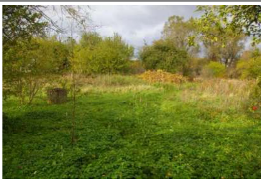
Zemes vienība ar kadastra apzīmējumu 6415 001 0100