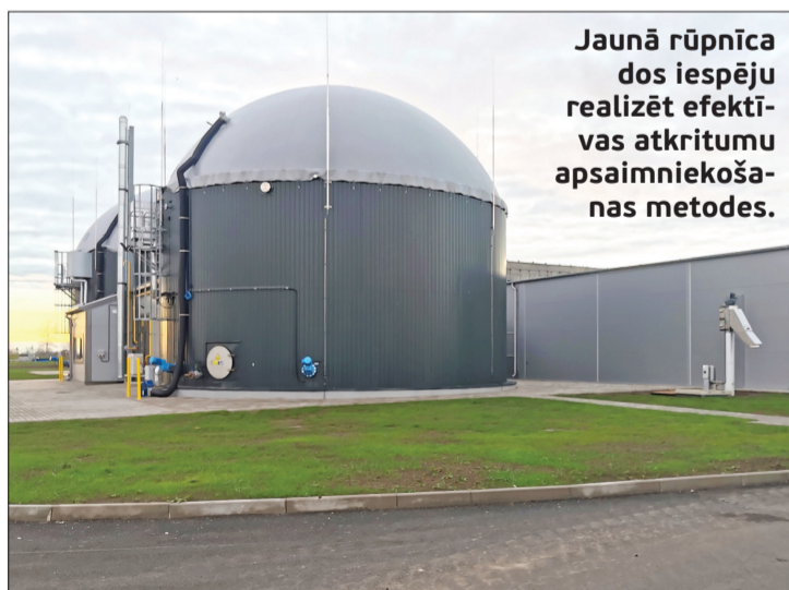
Jaunā rūpnīca dos iespēju realizēt efektīvas atkritumu apsaimniekošanas metodes.

No 2024. gada 1. janvāra Latvijā uzsāks bioloģisko atkritumu šķirošanu un dalīto vākšanu. Tā ietver pārtikas, dārza, dārzeņu un augļu atkritumus, koku la-