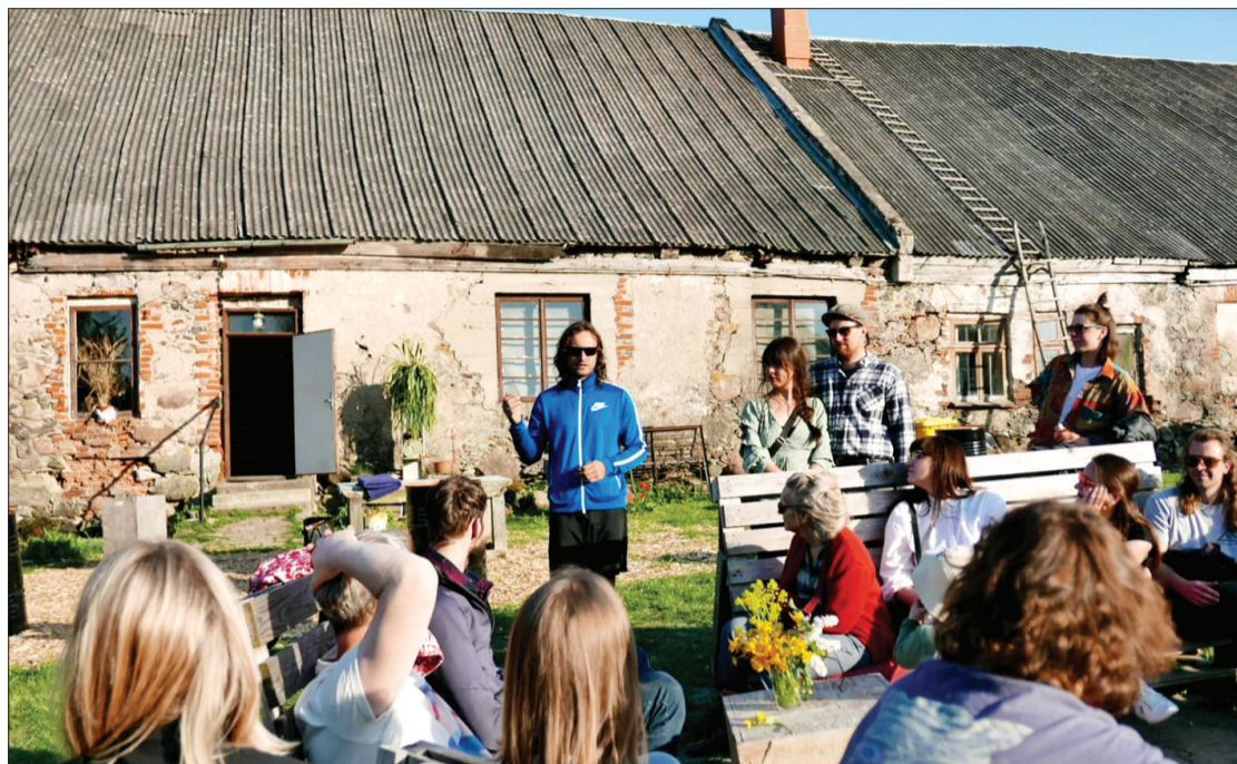
Projekta pasākumu ietvaros piedalījās arī Dienvidkurzemes novada pašvaldības pārstāvji, un noslēgumā katrs deputāts ir saņēmis vēstuli ar apkopotajiem iedzīvotāju priekšlikumiem.

Ceļš uz Aizputes atjaunošanu ir sācies jau pirms vairākiem gadiem, rīkojot ikgadējus arhitektūras studentu plenērus un dažiem entuziastiem uzsākot namu atjaunošanu. Tomēr par jaunu un visaptverošu pagrieziena Aizputes atdzimšanā var pamatoti saukt 2023. gadu, kad nostiprinājās nevalstisko organizāciju un pilsētas entuziastu sadarbība ar novada pašvaldību. Šogad ne tikai iedzīvotāji un Aizputes atjaunotāji, bet arī pašvaldības pārstāvji ir iesaistījušies kopīgas vīzijas veidošanā un sadarbībā, lai saglabātu vēsturisko mantojumu, kā arī ilgtermiņā piesaistītu talantus pilsētai, kurā iedzīvotāju skaits lēnām samazinās. Gan nevalstisko organizāciju, gan pašvaldības pārstāvji ir ie-