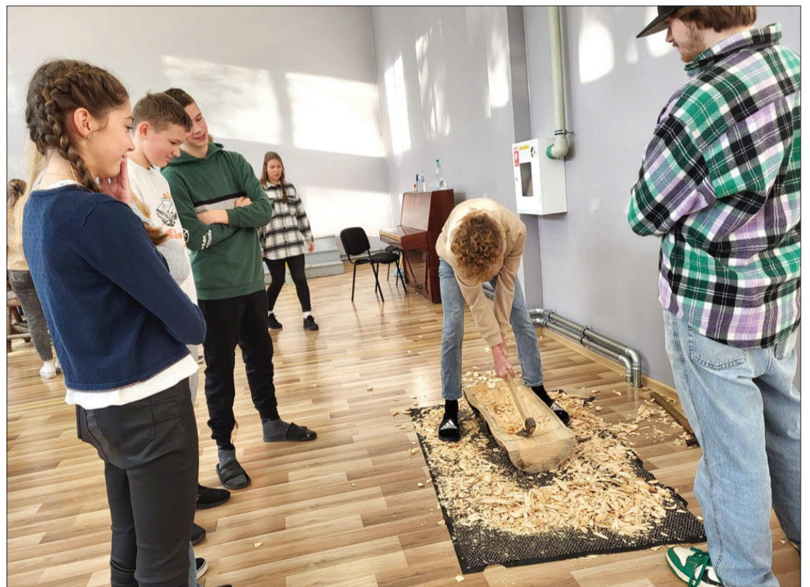
Skolēniem pašiem darboties ar dažādiem instrumentiem, apstrādājot koku, – bija aizraujoši.

5. un 6. klases bērni Bauskas pils muzejpedagoģiskā nodarbībā "Vecā naudas maka stāsts", darbojoties lomu spēlēs, izziņāja naudas maiņas procesu, kas