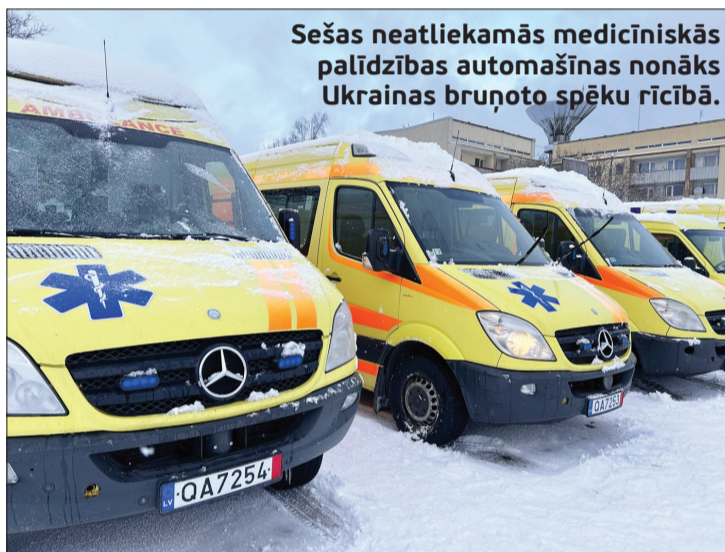
Sešas neatliekamās medicīniskās palīdzības automašīnas nonāks Ukrainas bruņoto spēku rīcībā.

Automašīnas uz Ukrainu nedevās tukšas – Dienvidkurzemes novada pašvaldība sadarbībā ar labdarības organizāciju “Tabitas sirds” tās piepildīja ar humānās palīdzības kravu: segām, spilveniem un gaļas konserviem Ukrainas bruņoto spēku vajadzībām.