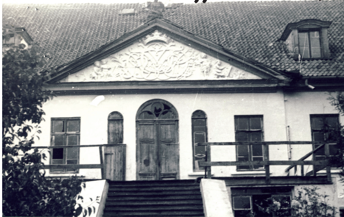
Senajā fotogrāfijā redzams skats uz Apriķu muižas dienvidu frontona cilni.

Restaurācijas laikā rasti būtiski atklājumi gan par cilni, gan Kurzemes un Latvijas teritorijas baroka laika mākslu: atrastas liecības par tehnoloģijām, kādās veikti vēsturiskie krāsojumi, par cilņa sākotnējo niansēto krāsojumu un vēlākiem grezniem pārkrāsojumiem, kā arī liecības par laiku, kad atjaunošanas darbi