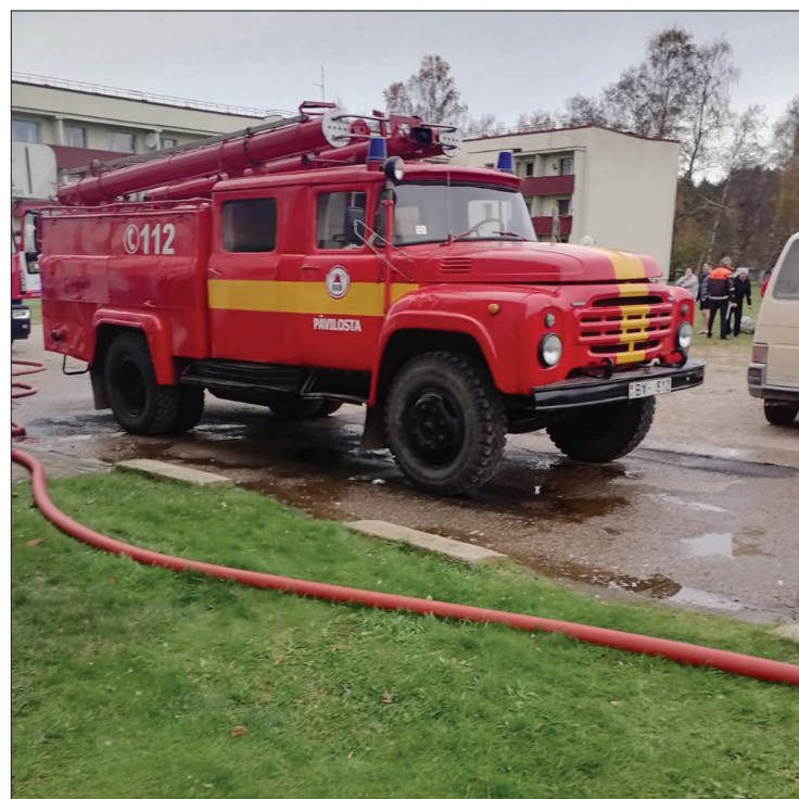
Projekta īstenošanas laikā plānots iegādāties aprīkojumu novada ugunsdzēsējiem un to automašīnām.

Informāciju sagatavojuši Dienvidkurzemes novada pašvaldības Attīstības un uzņēmējdarbības daļa