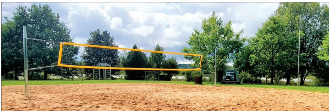
Pie Aizputes peldētavas izveidotais volejbola laukums ir iespēja izkustēties šī sporta veida mīļotājiem.

Pavasaris un vasara bijis darbīgs laiks novada biedrībām un reliģiskajām organizācijām – tās realizējušas projektu idejas, kuras pašvaldības konkursā guvušas līdzfinansējumu.