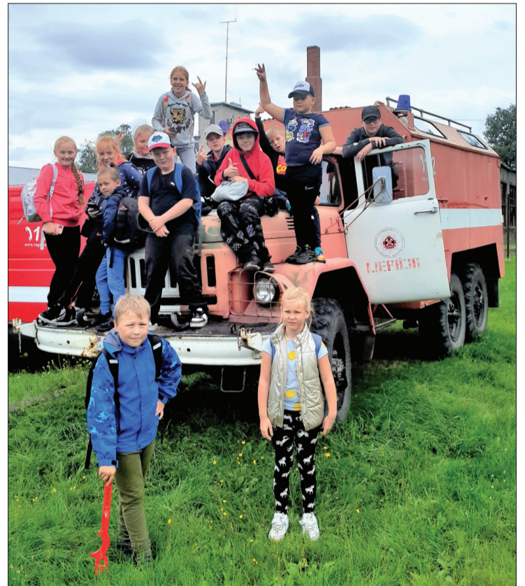
Papildināt zināšanas ugunsdrošībā ikvienam ir svarīgi.

Atpūtas pasākumā "ma-DARRA", kas norisinās Ziemupes jūrmalas stāvlaukumā, par pašvaldības līdzfinansējumu, bija no-