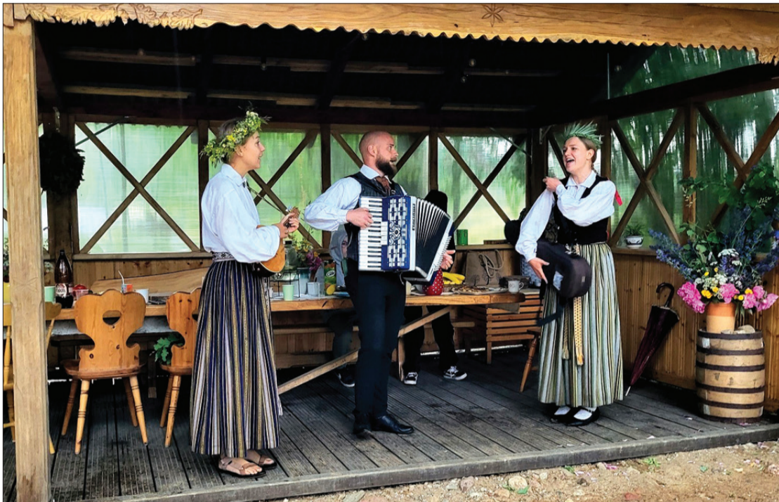
Saulgriežu ieskaņas pasākumā "Sauksim sauli" varēja gan apgūt dažādas prasmes, gan lustīgi uzdziedāt.