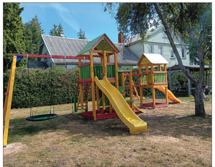
Priekules baptistu draudzes nama teritorijā uzstādīto bērnu rotaļu laukumu var izmantot ikviens bērns.

drošināta kvalitatīva pasākuma apskaņošana. Pasākums Ziemupē norisinās jau vairākus gadus un ar savu plašo programmu piesaista dalībniekus un apmeklētājus no visas Latvijas. Pasākuma laikā norisinās dažādas darbnīcas, bija iespēja piedalīties meistarklasēs un vakarā klausīties koncertu, kurā piedalījās ne tikai zināmi mākslinieki, bet arī jaunie censoņi no mūsu pašu novada.