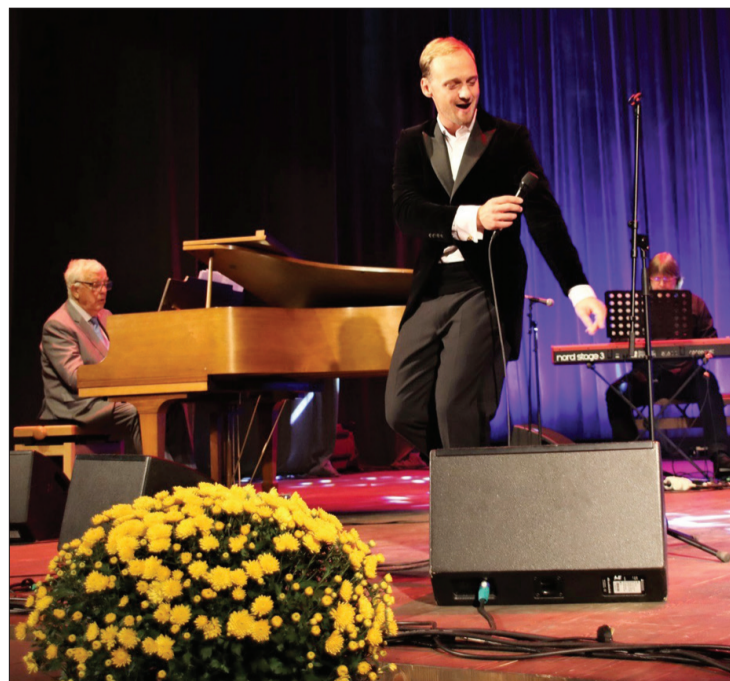
Starptautiskajai senioru dienai veltīts koncerts turpinās kā ikgadēja tradīcija arī Dienvidkurzemes novadā. 2022. gadā Nīcā ar koncertu uzstājās Maestro Raimonds Pauls un Daumants Kalniņš.

Ieeja koncertā bez maksas. Koncertam pieteikties, zvanot 26681805. Nepieciešamības gadījumā tiks nodrošināts transports.