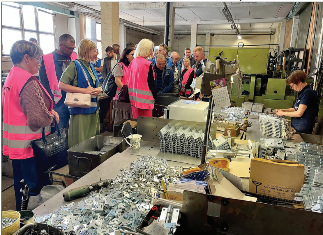
Lielākā daļa Dienvidkurzemes novada uzņēmēju pirmo reizi ieraudzīja atslēgu ražošanas procesu.

Aizputē 14. septembrī uz kārtējo tikšanos pašvaldība aicināja Dienvidkurzemes novada uzņēmējus, lai pārrunātu šī brīža aktualitātes, uzzinātu par jaunumiem valsts instancēs un nedaudz iepazītu novada uzņēmējus.