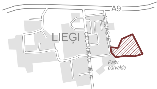
Lokāplānojuma teritorijas atrašanās vieta