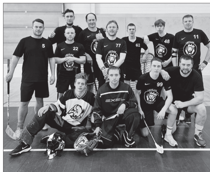
B divīzijā uzvarētāju godā komanda "EX Leģions".