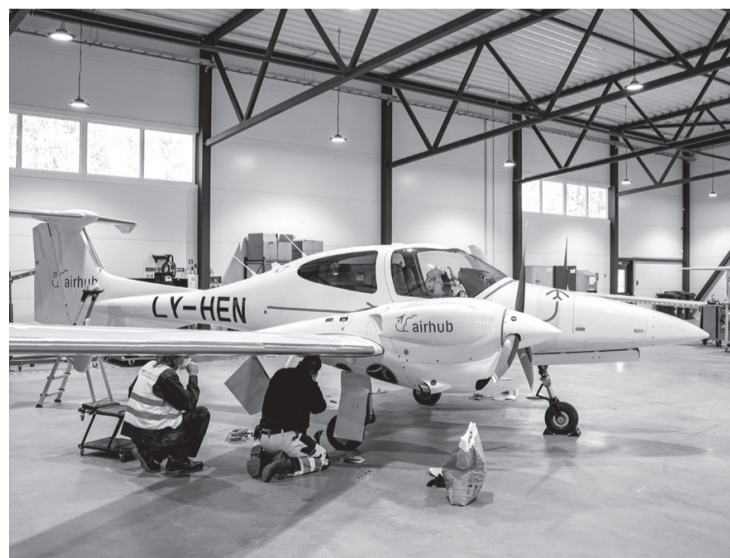
Viena no profesijām, ko iespējams apgūt gan pēc 9. klases, gan 12. klases beigšanas, ir Gaisa kuģa mehāniķis.

Sagatavojuši: Attīstības un uzņēmējdarbības daļa