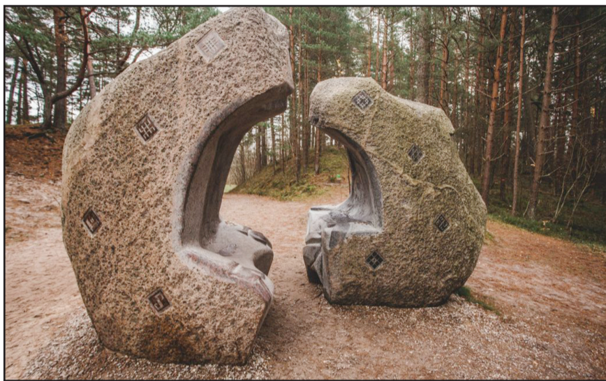
Bernātu dabas parkā ierīkotas septiņas tematiskas pastaigu takas, kurās radīta iespēja aktīvi atpūsties un izzināt latviešu mitoloģiju.

Latvijas Ainavu arhitektu asociācijas skatē "Latvijas ainavu arhitektūras balva 2022" nominācijā "Ārtelpa" bija pieteikti divi projekti no Dienvidkurzemes novada, un abi saņēma balvas.