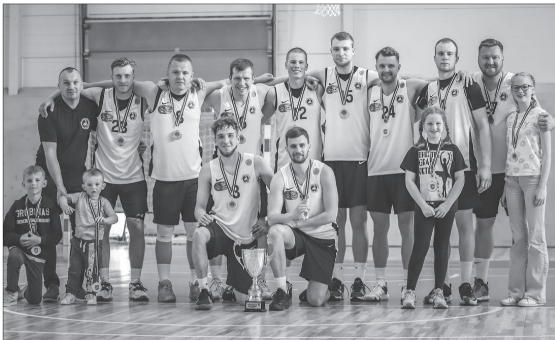
Dienvidkurzemes novada kausu basketbolā izcīnīja komanda "Grobiņa".

Fināla spēles norisinājās Grobiņas pilsētas svētku laikā – 27. maija pēcpusdienā. Spēlē par 3. vietu tikās "Priekules" un "Vērgales" komandas. Šoreiz priekulniekiem nācās piekāpties,