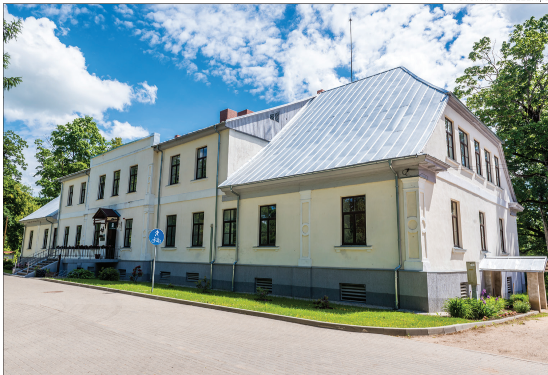
Iepazīsti Aizputes novadpētniecības muzeju gan klātienē, gan muzeja mājaslapā www.aizputesmuzejs.lv .

Īpašs gandarījums ir par 2015. gadā realizēto Eiropas Lauksaimniecības fondam aktivitātē "Lauku mantojuma saglabāšana un atjaunošana"