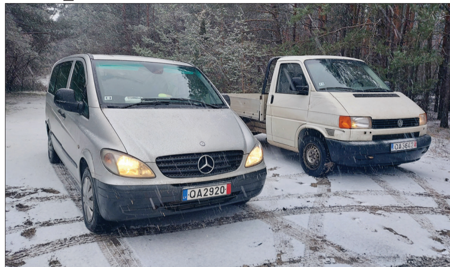
Abas Dienvidkurzemes novada dāvinātās automašīnas būs atbalsts Ukrainas bruņotajiem spēkiem.

Simtiem sveču, darinātas mūsu novada iedzīvotāju rokām, aizceļoja uz Ukrainu, lai palīdzētu tur cilvēkiem sasildīties un arī pagatavot ēdienu.