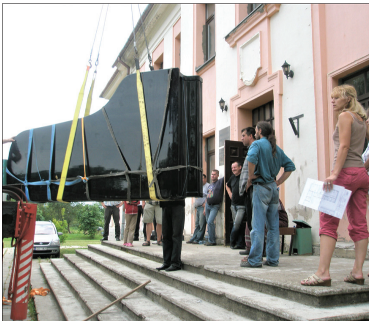
2008. gadā ar audzēkņu tēvu palīdzību uz jaunajām telpām kopā ar 17 klavierēm pārceļoja arī koncertflīģelis "Estonia", kurš vēl joprojām skan un ir kā skolas vēstures liecība.