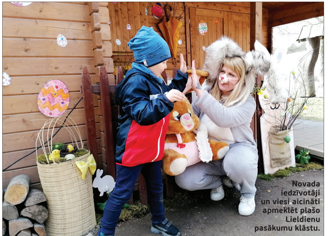
Novada iedzīvotāji un viesi aicināti apmeklēt plašo Lieldienu pasākumu klāstu.

Vairāk par Lieldienu pasākumiem skatīt izdevuma rakstā "Kultūras pasākumu plāns".