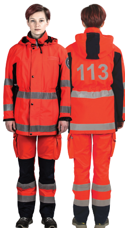
NEATLIEKAMĀS MEDICĪNISKĀS PALĪDZĪBAS DIENESTA BRIGĀDES DARBINIEKS