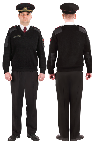
UGUNSDZĒSĒJS GLĀBĒJS UN INŠPEKTORS