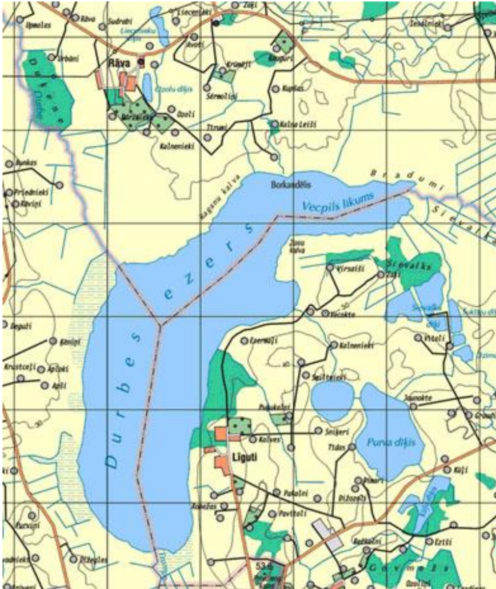
Durbes ezera shēma.