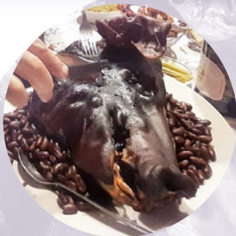
cūkas šņukurs - šņukurīts

Lai duršu, kur duršu, Durš` krāsnes podā.