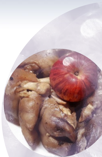
cūku kājiņas – cimboļi

Es tai nama saimēniecei Dižu prieku pasaciš': Duj' laivīnas jēru nāce, Trešā maģu suvēnīn'. Sasāgrieza ķekatīnas istubīnas dubenā; Sāgriez, Dievīn, rudzus miežus Saimēnieka druvīnā.